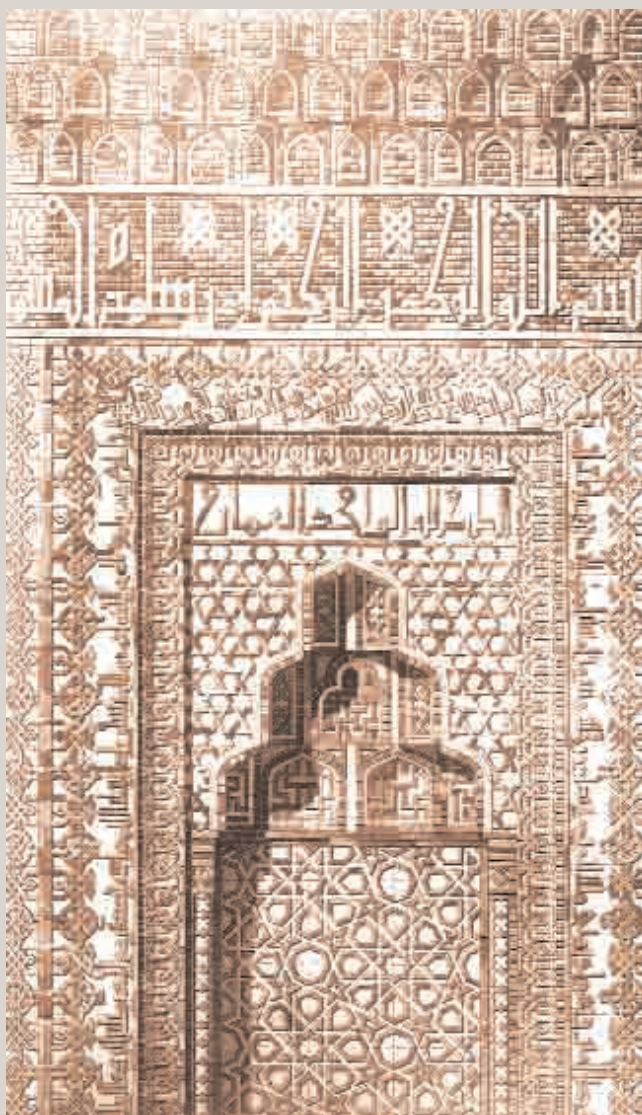
Грань мавзолея Момине-хатун