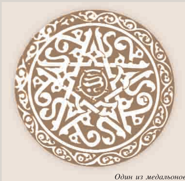
Один из медальонов внутри мавзолея Момине-хатун

Академик Зия Муса оглы Буньятов, исследуя этот вопрос на основе трудов таких авторов, как Равенди, Ибн ал-Азрак ал-Фарики, датирует смерть Момине-хатун 9 раби-ал-аввал 571 г.х.=30.09.1175.