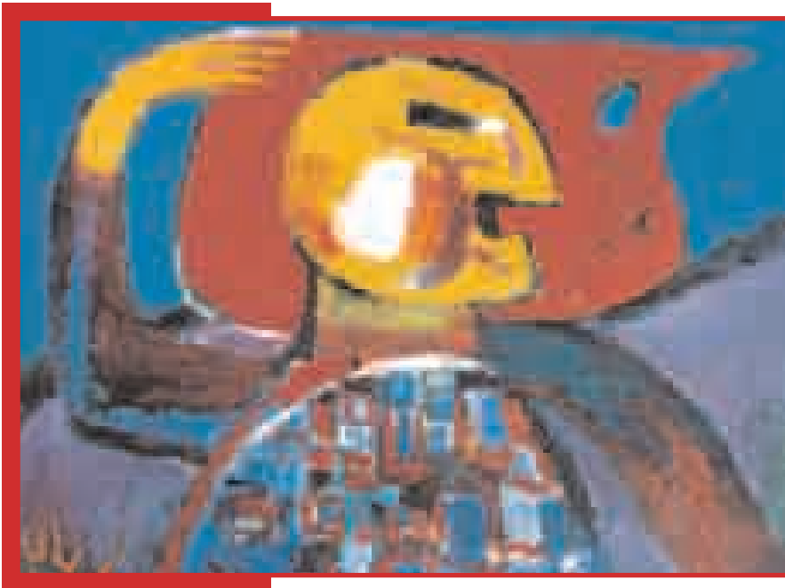
Любовь Мирджавадова. Джавад .

но, по аналогии с телефильмом "Это - Саттар" - одной из моих первых работ, посвященным Саттару Бахлулзаде).