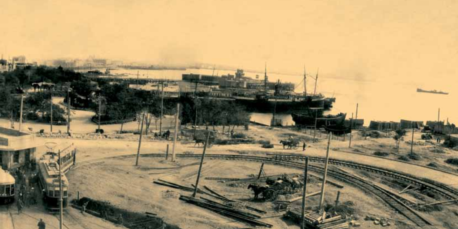
Панорама набережной с нынешней пл. Азнефт. 1930 г.

В послевоенные годы в связи с поднятием уровня воды на Каспии и частичной реконструкцией бульвара купальня была ликвидирована. К началу 50-х годов Приморский бульвар протягивался вдоль побережья Каспия на 2,7 км от судоремонтного завода им. Парижской коммуны до нового морского пассажирского вокзала. В 1966 году по проекту М.Гусейнова на Приморском бульваре в районе нынешней площади «Азадлыг» была создана выдвинутая к морю площадка. Эта площадка заканчивалась сходами к морю, декорированными партерной зеленью, цветниками и каскадом фонтанов. В 1967 году этим же автором был разработан проект реконструкции всего Приморского бульвара. В связи со значительным понижением уровня