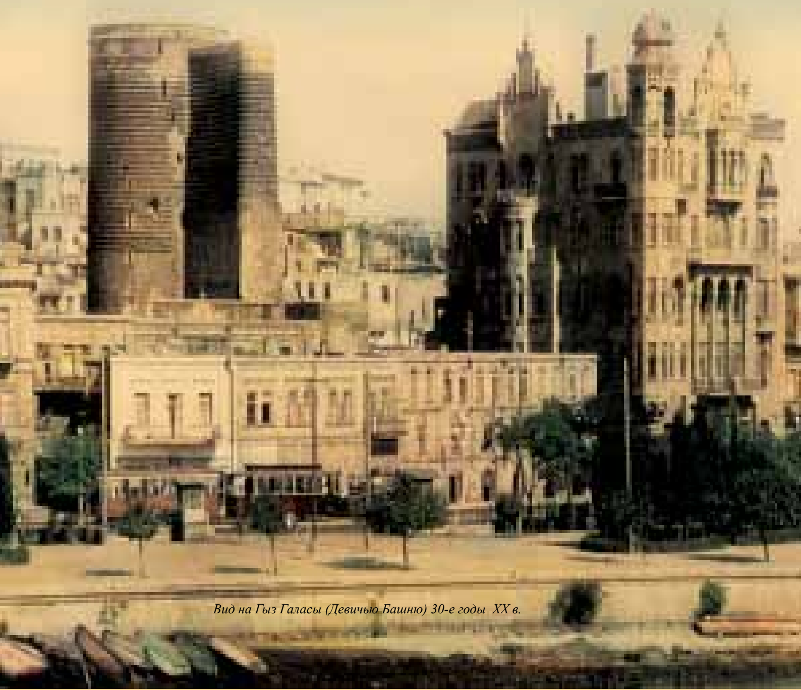
Вид на Гыз Галасы (Девичью Башню) 30-е годы XX в.

P.S. В последующих номерах журнала будет опубликована статья о новом облике бакинского бульвара, о дальнейших планах в этом отношении