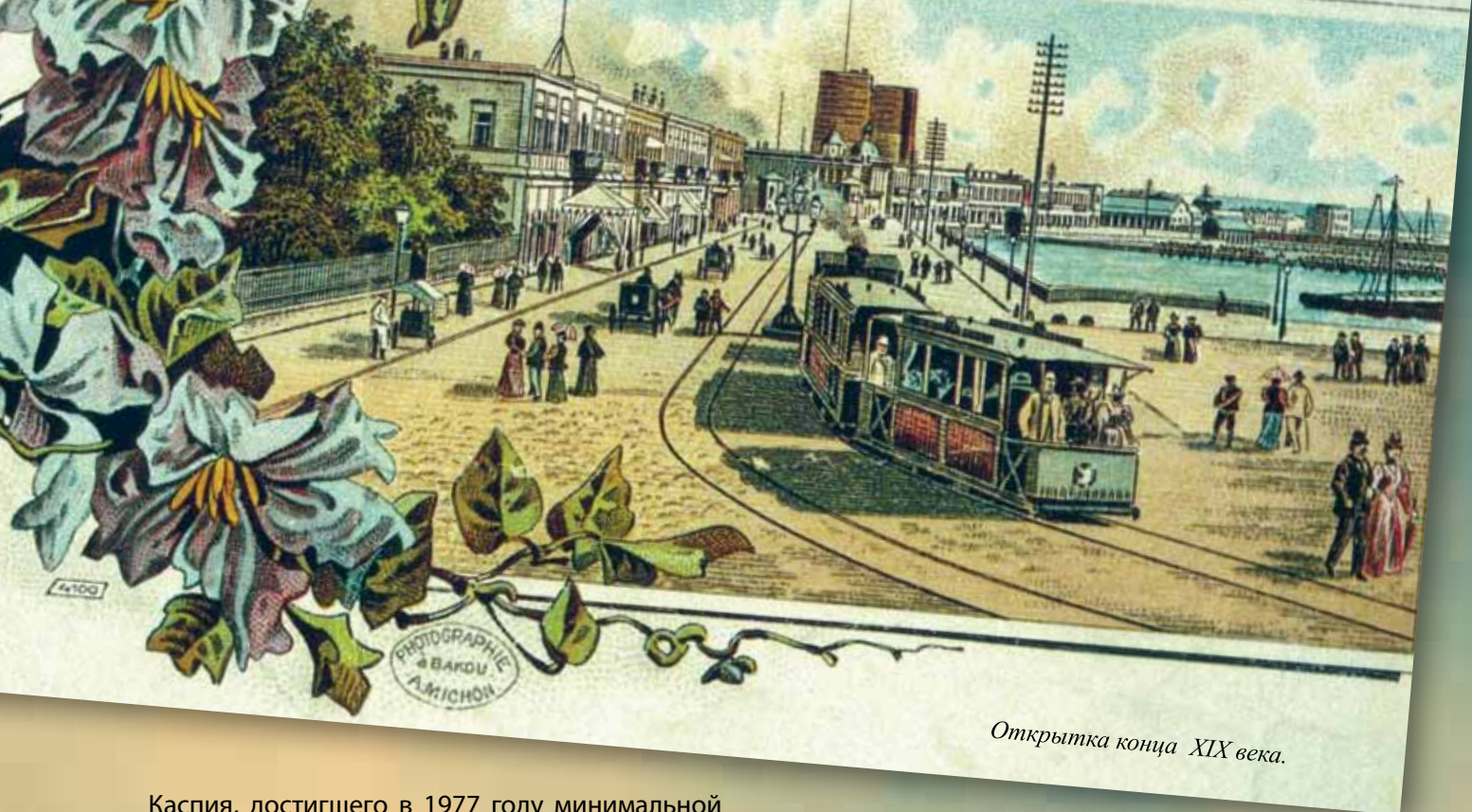
Открытка конца XIX века.

Каспия, достигшего в 1977 году минимальной отметки, и обнажением широкой полосы бывшего морского дна, были проведены работы по созданию нижней террасы Приморского парка, здесь устроены аллеи, газоны, фонтаны.