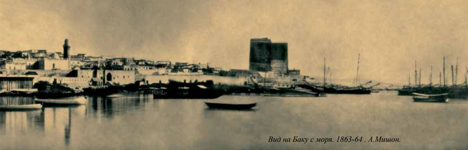
Вид на Баку с моря. 1863-64 . А.Мишон.

современники замечали, что самая блестящая часть Баку – его набережная.