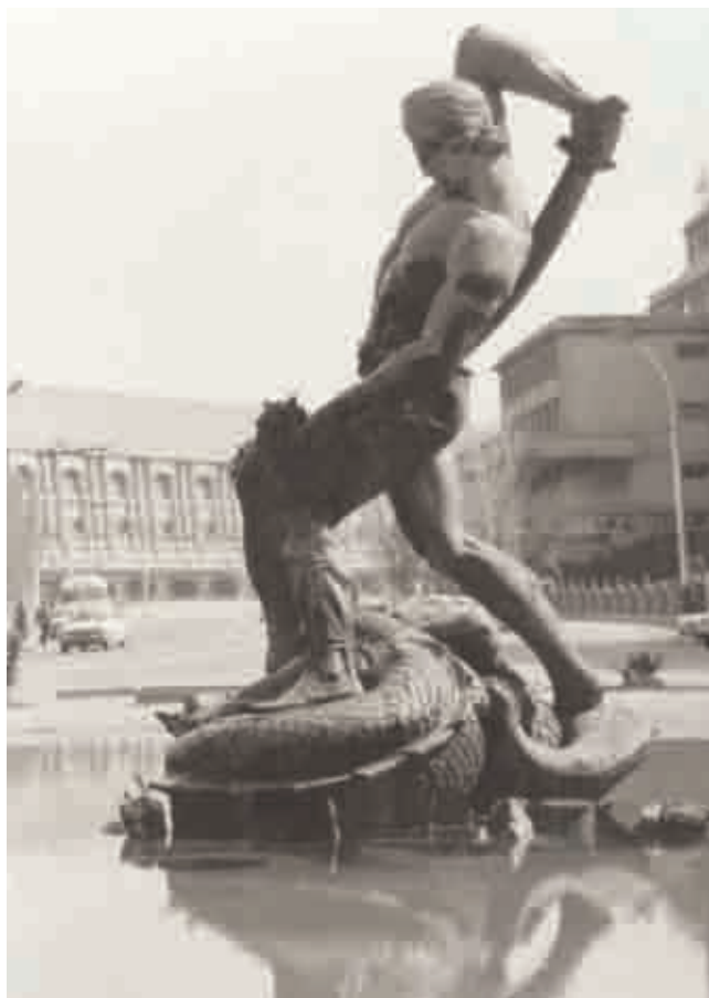
Композиция “Бахрам Гюр”. г. Баку. 1959 г.