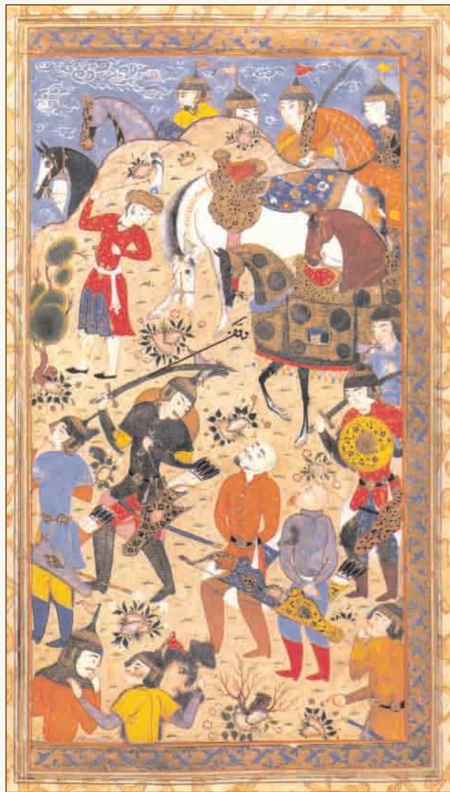
“Искандернаме”. 60-70-е годы XVI века.

Если при Тимуре Самарканд гремел своей славой, а Герат в XV в. стал культурным центром всего Среднего Востока, то в XVI в. азербайджанский город - Тебриз стал своего рода магни-