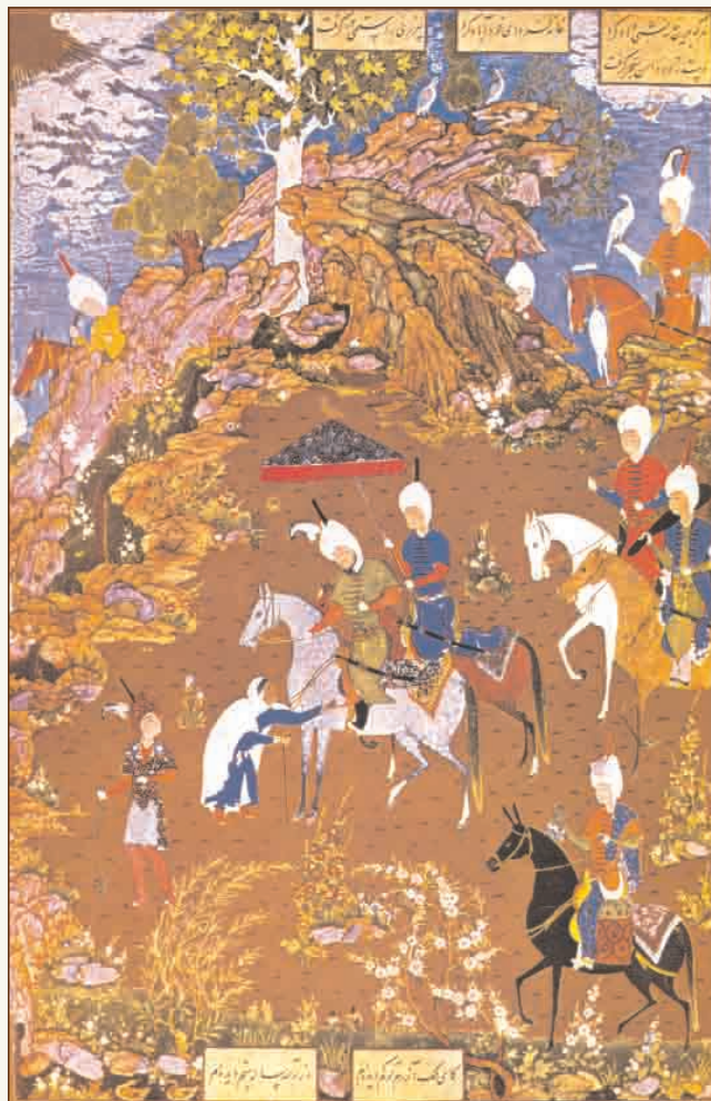
Султан Санджар и старуха. “Хамсе”. 1539-1543 гг. Лондон. Британский музей. Худ. Султан Мухаммед.

К XVI в. тебризская школа миниатюры пришла “очищенной” от монгольско-китайского влияния. Только кудрявые облачки “Чи” и фантастические существа (драконы, фениксы) сохранились как изобразительные элементы в тебризской ми-