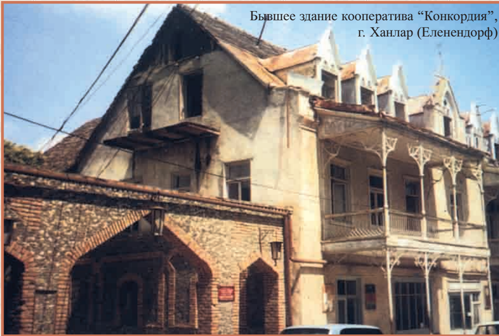
Бывшее здание кооператива "Конкордия", г. Ханлар (Еленендорф)