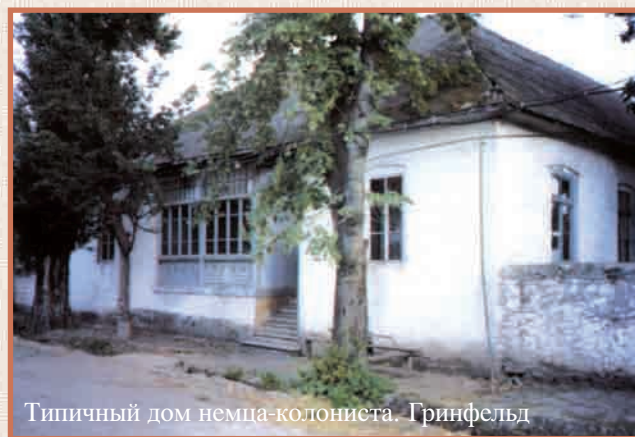
Типичный дом немца-колониста. Гринфельд

По обеим сторонам улиц стояли дома колонистов с приусадебными участками в так называемом "аллеманском стиле"; каждый имел нумерацию и на улице выходил фасадом. Дома были одно- или двухэтажные, представляя собой "комплексное сооружение": двор объединял жилые и хозяйственные строения под одной крышей, с подвалами - винными погребами, чердак предназначался для сушения и хранения фруктов; в жилой части - несколько комнат и два балкона, выходящие на улицу и во двор. Дома крыты черепицей, наружные стены окрашены в основном в голубой цвет. При каждом доме имелись приусадебный сад и огород. На улице перед домом были высажены фруктовые и декоративные деревья.