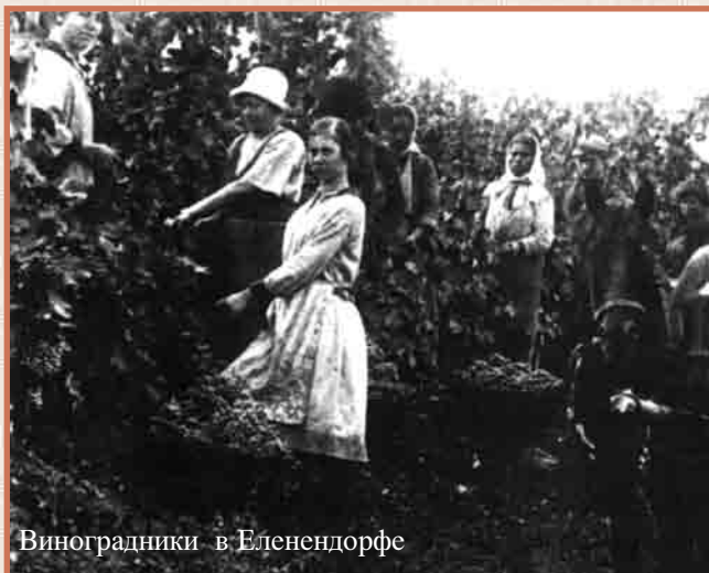
Виноградники в Еленендорфе