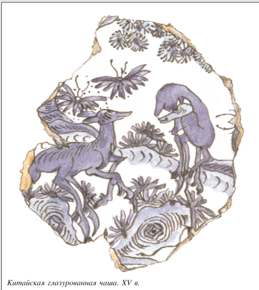
Китайская глазурованная чаша. XV в.

Экономика города базировалась на ремесленном производстве. Остатки производственных сооружений, различные орудия труда ремесленников и многочисленные керамические, металлические, стеклянные, каменные и другие изделия, найденные при археологических раскопках свидетельствуют о высоком развитии ремесленного производства. Археологам удалось выявить стандартизацию ремесленных изделий, что свидетельствует о наличии товарного производства. Другой отраслью, получившей высокое развитие было производство керамических изделий. Под руинами города обнаружена мастерская, в которой производилась лишь керамика. Благодаря этому стало возможным определить способы ее производства. Развалины города позволяют выяснить конструкции тех сооружений, в которых обжигалась глазурованная и простая глиняная посуда. Обнаружены заготовки,