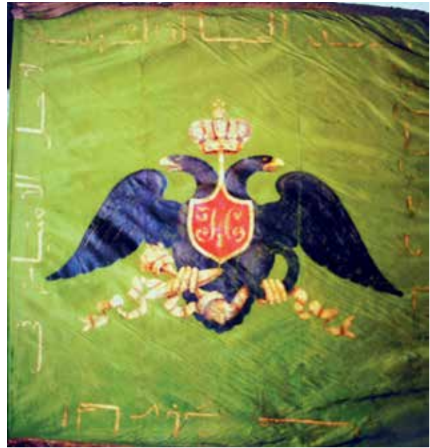
Почетное знамя Ширванской конной милиции.

С упразднением комендантской системы управления в Закавказье нахчыванский наиб генерал-майор Эсан-хан и его брат, ордубадский наиб майор Шейх-Али-бек были отстранены от управления вновь образованным Нахчыванским уездом. Полномочия Эсан-хана свелись лишь к командованию конницей кенгерли - ему было при-