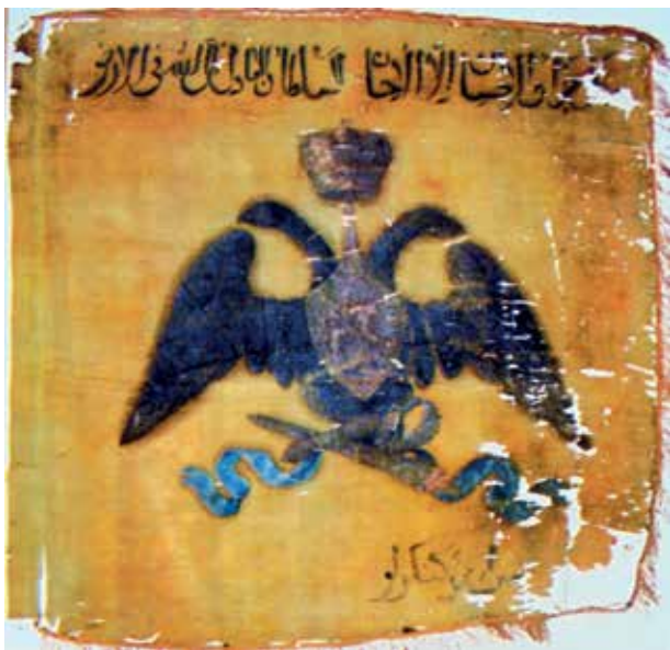
Знамя конницы Кенгерли. Национальный музей истории Азербайджана (НМИА)

Продолжение. Начало см. IRS–Наследие , 2019, № 1-3 (97-99)