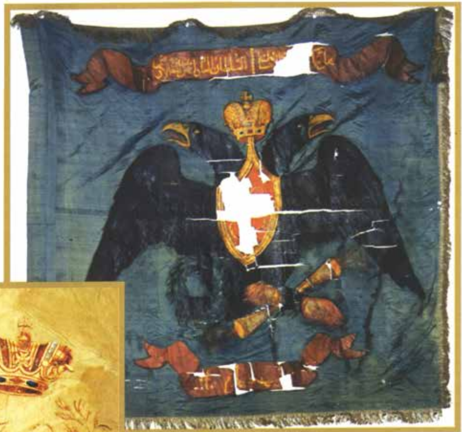
Боевое знамя 4-го конно-мусульманского полка. НМИА ФОЗ