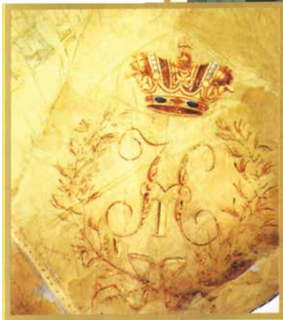
Фрагмент почетного знамени 3-го конно-мусульманского полка. НМИА ФОЗ

чения и воспитания». В России до 1870-х годов к иррегулярным войскам причислялись казаки и милиция, а затем казаки были выделены в особую категорию войск, и к иррегулярным войскам стали относить только милицию, выставляемую местным населением на Кавказе и в Закаспийской области (например, Дагестанский конный полк, Кубанская, Терская, Дагестанская, Карсская и Батумская милиции, Туркестанский конно-иррегулярный дивизион).