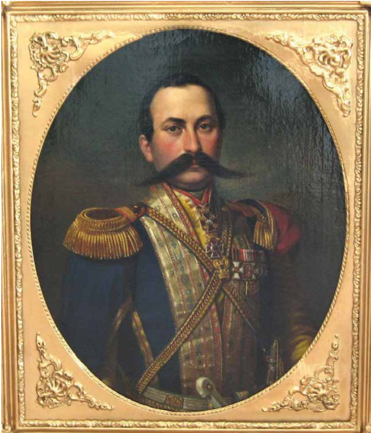
Портрет Гасан бека Агаларова в мундире Закавказского конно-мусульманского полка. Варшава, 1856 год, Художник К.К.Каневский. НМИА. Фонд изобразительного искусства

Первые иррегулярные полки, сформированные из азербайджанцев, появились в России в самом начале царствования императора Николая I (1825–1855 гг.). Но еще до этого воинские формирования из азербайджанских владений активно использовались российским коман-