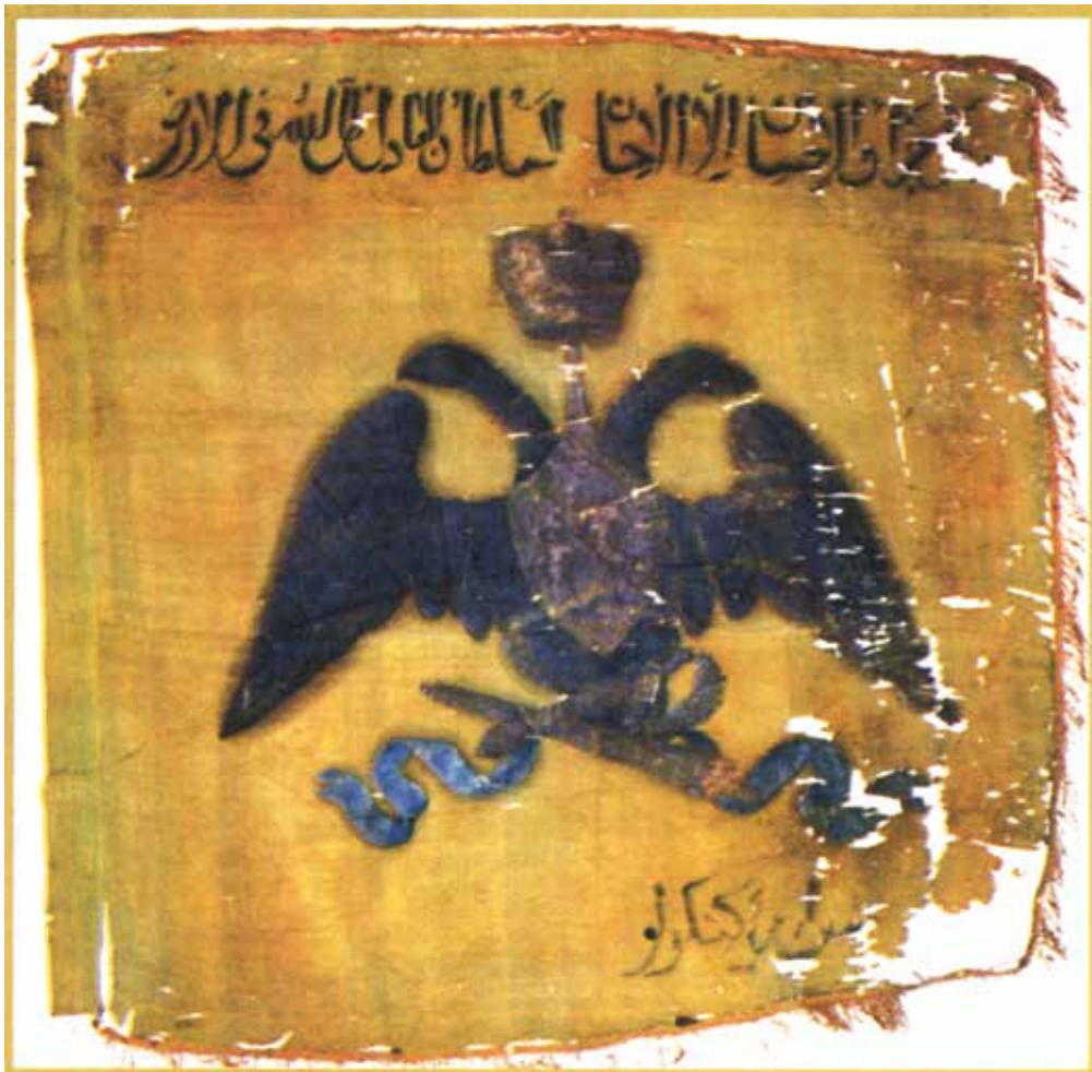
Почетное знамя конницы Кенгерли. Национальный музей истории Азербайджана. Фонд оружия и знамен (НМИА ФОЗ)

В военной истории Азербайджана особое место занимают иррегулярные части, которые формировались в XIX столетии после захвата региона Россией из азербайджанцев, или, как их называли в