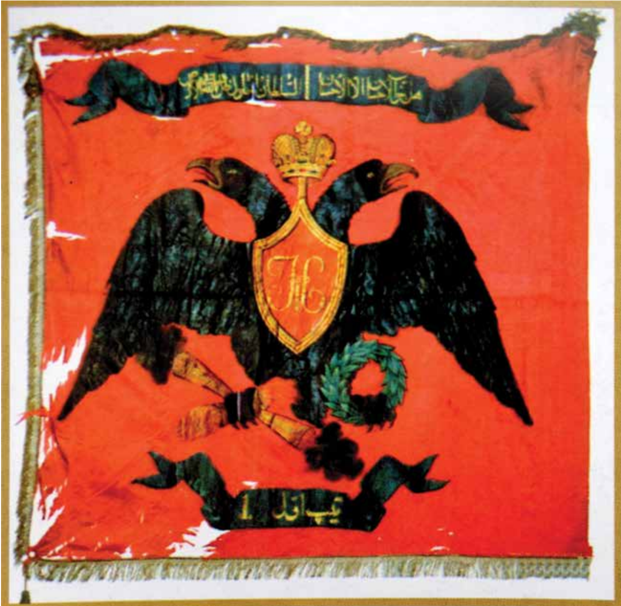
Почетное знамя 1-го конно-мусульманского полка.

манский полк из жителей Карабахской провинции; 2-й – из жителей Шекинской и Ширванской провинций (бывшие одноименные ханства); 3-й – из жителей Елисаветпольского округа (бывшее Гянджинское ханство) и «татарских» дистанций: Борчалинской, Казахской и Шамшадильской (бывшие одноименные султанства); 4-й – из жителей так называемой Армянской области (бывшие Эриванское и Нахчыванское ханства); 250 бойцов конницы Кенгерлы набирались из жителей бывшего Нахчыванского ханства (4, с. 18). Командирами конных мусульманских полков назначались русские штаб- и обер-офицеры, а помощниками к ним - «беки из самых лучших и богатейших фамилий, имеющие