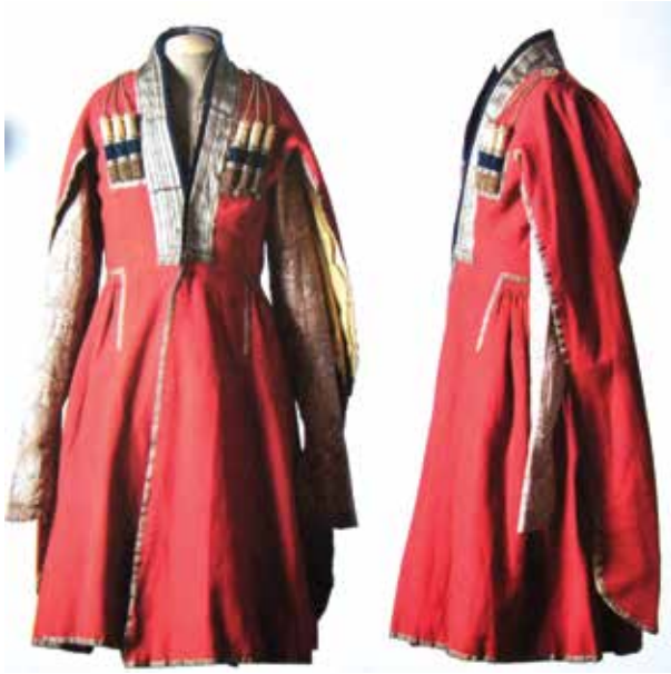
Мундир (чуха) и бешмет (архалык) офицера конно-мусульманского полка. Начало XIX века. Государственный исторический музей (Москва)

ницу». Конно-мусульманские полки должны были собираться только «в экстренном случае». Личный состав конно-мусульманских полков в военное время должен был состоять на содержании правительства и в материальном обеспечении приравнивался к русским регулярным и казачьим полкам. В период военных действий всадникам азербайджанских конных полков полагалось выплачивать по 15 рублей серебром, «а бекам, имеющим офицерские чины», – оклады, равные окладам офицеров Нижегородского драгунского полка. За границей предполагалось производить и рационы (14). ❀