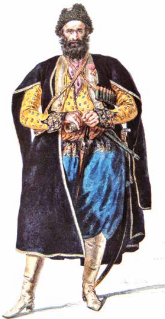
Закавказский мусульманин (азербайджанец). Неизвестный художник

храбростью и постоянным мужеством служившим в войне с Турцией», пожаловал им особые знамена с изображением российского герба и с сохранением в гербе изображения Св. Георгия; на древках же знамен вместо креста было помещено вензелевое имя императора. При этом почетное знамя 1-го конно-мусульманского полка было предписано хранить в г. Шуше «как знак Монаршего Нашего внимания к верности и заслугам жителей Карабахской провинции и Пессиянских куртин, составлявших 1-й Мусульманский полк»; почетное знамя 2-го конно-мусульманского полка было предписано хранить в г. Шамахе «как знак Монаршего Нашего внимания к верности и заслугам жителей Ширванской и Шекинской провинций, составлявших 2-й Мусульманский полк»; почетное знамя 3-го конно-мусульманского полка