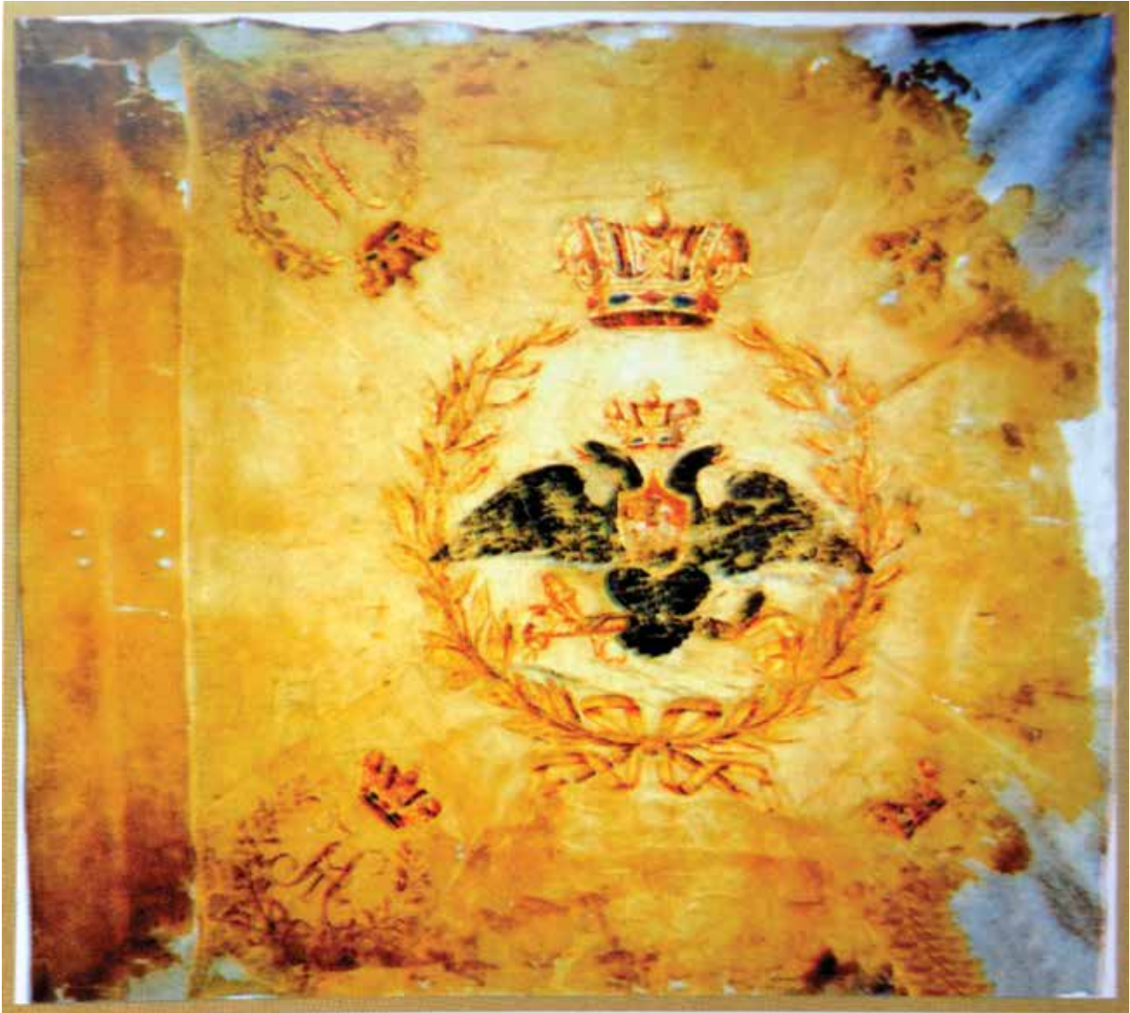
Почетное знамя 1-го конно-мусульманского полка.

образно. В палатке Генерала Раевского собирались Беки Мусульманских полков; и беседа шла через переводчика... 17 июня утром услышали вновь мы перестрелку и через два часа увидели Карабахский полк возвращающимся с осмью Турецкими знаменами... 19-го... около шестого часу войска опять получили приказ идти на неприятеля... Первые в преследовании были наши Татарские полки (т.е. азербайджанские конно-мусульманские полки – Э.И.), коих лошади отличаются быстротою и силою...». Пушкину пришлось также быть свидетелем «необыкновенной картины»: «Под деревом лежал один из наших татарских беков, раненый смертельно. Подле него рыдал его любимец. Мулла, стоя на коленях, читал молитвы. Умирающий бек был чрезвычайно спо-