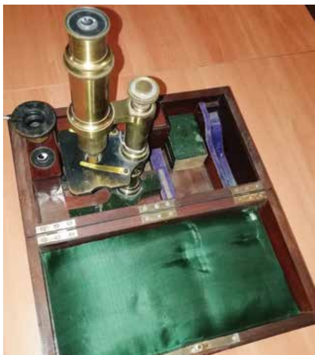
Микроскоп, принадлежавший М.Р.Векилову. НМИА. Публикуется впервые

платными , т.е. доступными для всех. 1-ю городскую бесплатную лечебницу для бедных (ныне 2-я городская поликлиника) возглавил сам Мамед Рза Векилов (1).