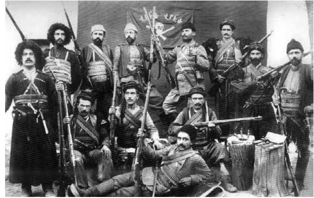
Один из армянских террористических отрядов. 1915 год