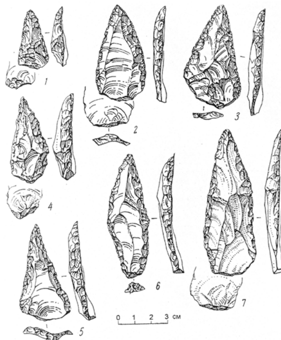
Пещера Таглар. Образцы леваллуазских ретушированных и мустьерских остроконечников. По М.Гусейнову

стоянке было найдено несколько микролитических орудия, аналоги которых зафиксированы на стоянках Гая-Арасы и Фируз в Гобустане . Что касается верхне-палеолитических орудий труда, найденных при раскопках третьего культурного слоя, то аналоги их были выявлены и изучены во втором культурном слое многослойной палеолитической стоянки на берегу р. Куручай . Материалы, найденные на Шущинской палеолитической стоянке в ходе археологической разведки летних полевых работ 1971-1973 гг., наглядно свидетельствуют о расселении первобытного человека на данной территории. Следует отметить, что полная стратиграфия культурных слоев на этой стоянке не конкретизирована – этот вопрос будет решен в ходе будущих археологических исследований. В конце 80-х годов было запланировано продолжить работу в этом направлении, но начало трагических событий в Карабахе и вокруг него, последовавшая военная оккупация края Арменией нарушили эти планы. С этого времени армянская сторона проводит в Карабахе – на оккупированной территории Азербайджана археологические раскопки в нарушение действующих норм международ-