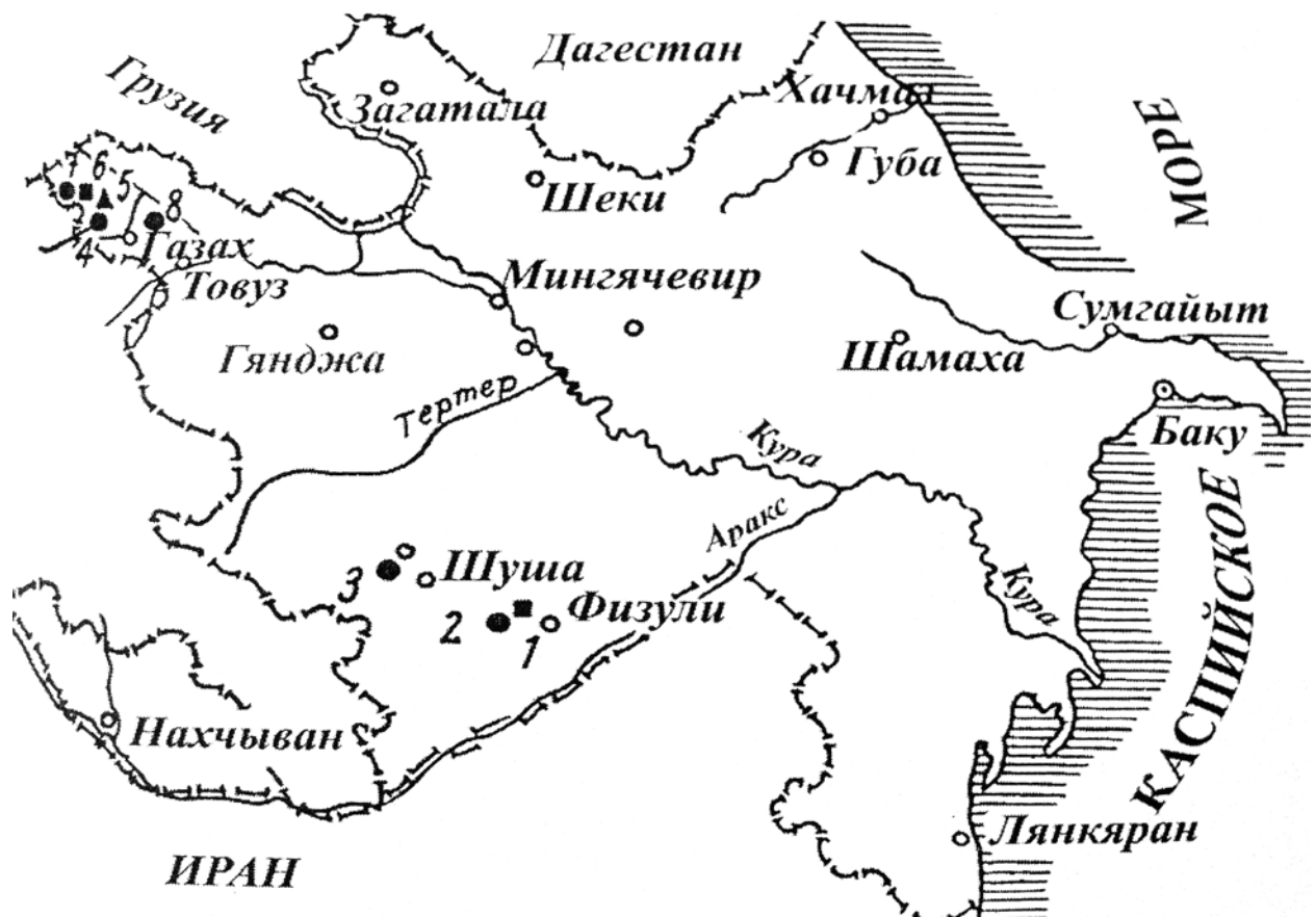
Карта распространения палеолитических памятников в Азербайджане (по М.Гусейнову). 1-Азых; 2-Таглар; 3-Шушинская пещера; 4-Даш-Салахлы; 5-Дамджылы; 6-Каялы; 7-Мараллы; 8-Чакмаглы

Азербайджана во главе с М.Гусейновым провела такую археологическую разведку на указанной территории. Работы проведены на территории города, на равнине Джыдыр и вокруг нее, а также по обоим берегам реки Дашалты, в результате зафиксирована Шушинская пещерная стоянка в нижней части равнины Джыдыр, расположенная на абсолютной высоте 1400 м и на высоте 80 м над современным руслом реки Дашалты. Длина пещеры составляет 120 м, ширина – 20 м. В ходе первоначальных раскопок было зафиксировано в первом приближении 4 культурных слоя. В первом и втором слоях были обнаружены обломки глиняной посуды, относящейся к широкому временному отрезку – средневековью, железному, бронзовому векам и энеолиту. При раскопках третьего культурного слоя были выявлены орудия мезолитического и верхне-палеолитического времени, а в четвертом слое – 2 груботесаных орудия, которые, судя по технике обработки и типологии, могут быть отнесены к ашельской культуре.