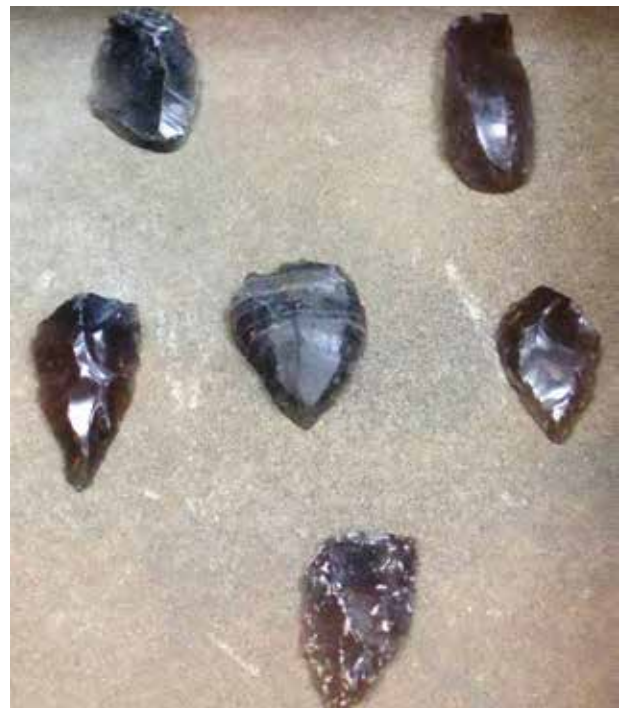
Орудия труда из обсидиана и кремния из памятников Таглар и Зар. Национальный музей истории Азербайджана

Примечательно, что при раскопках второго культурного слоя на Шушинской палеолитической