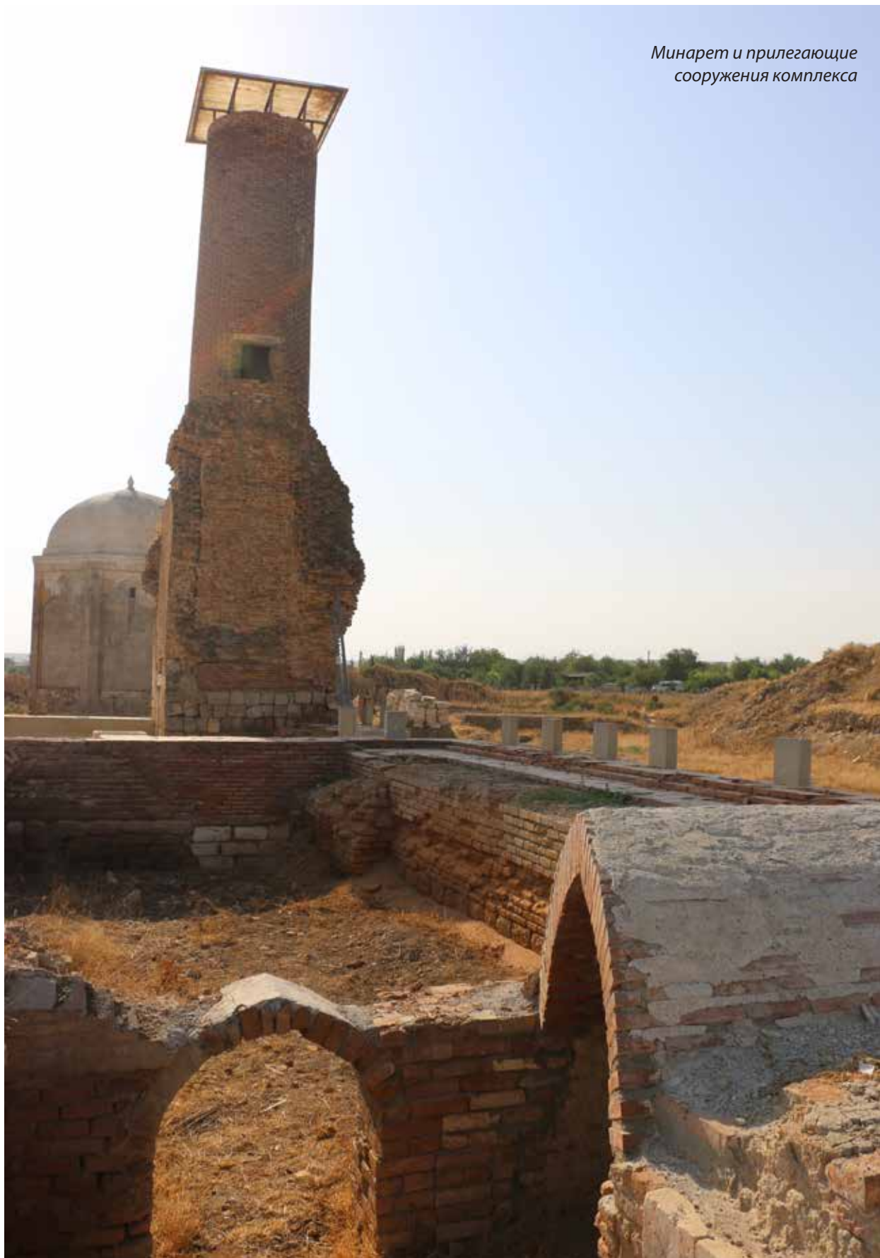
Минарет и прилегающие сооружения комплекса