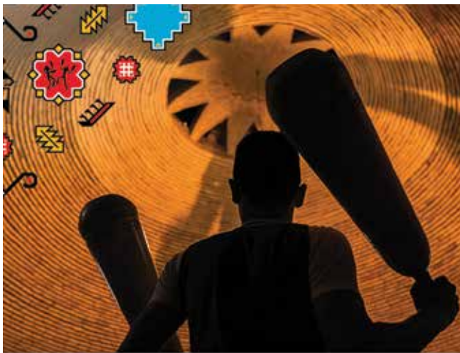
BAKU 2017 4th Islamic Solidarity Games Zurchhaneh