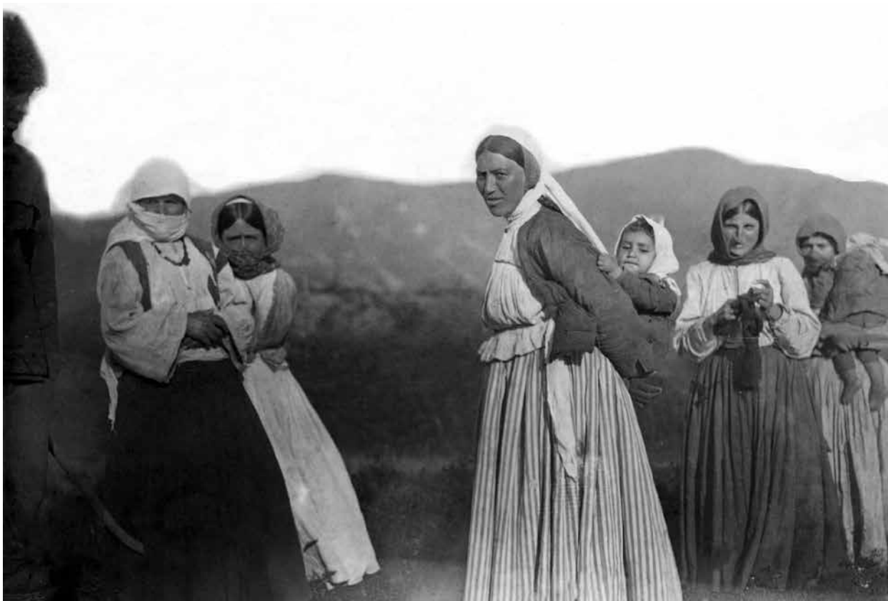
Ходжалы. Азербайджанки. 1927 г.