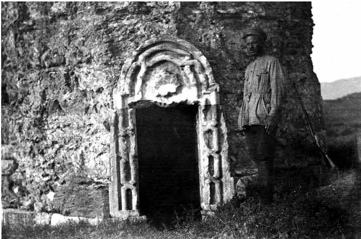
Ходжалы. Мавзолей. Оформление двери. 1926 г.