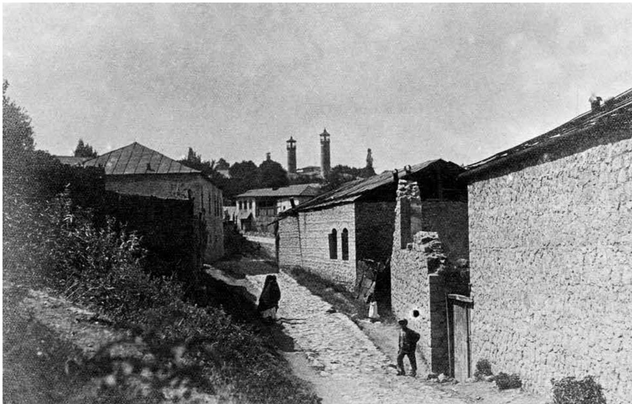
Шуша. Квартал Чухур мегелле. 1928 г. (здесь и далее в подписях к фотографиям сохранена стилистика и орфография А.Алекперова)