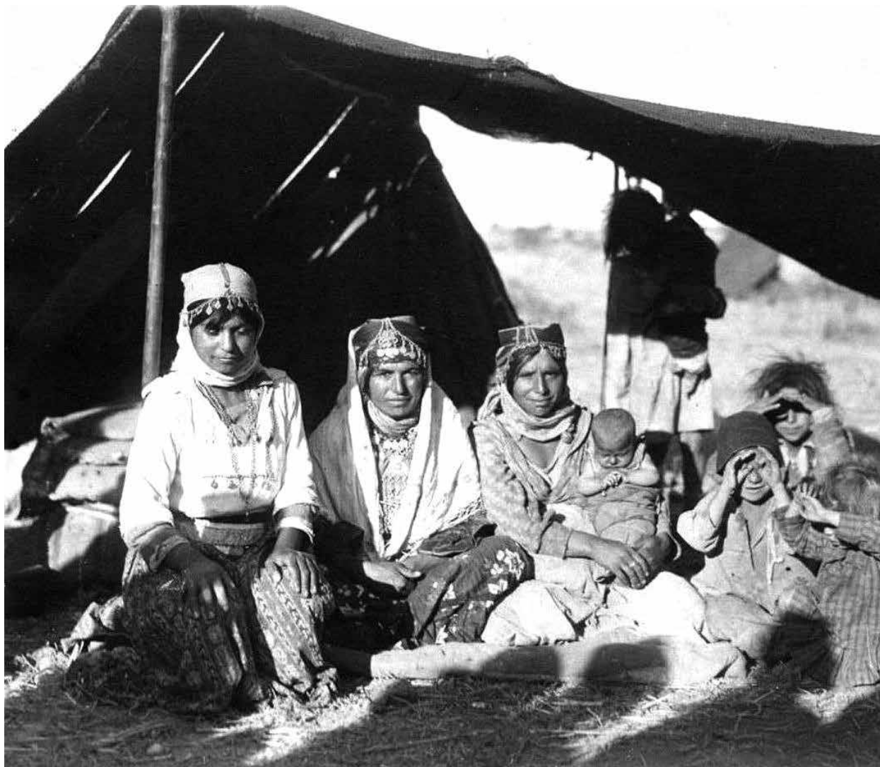
Кельбаджарский р-н. Курдянки.