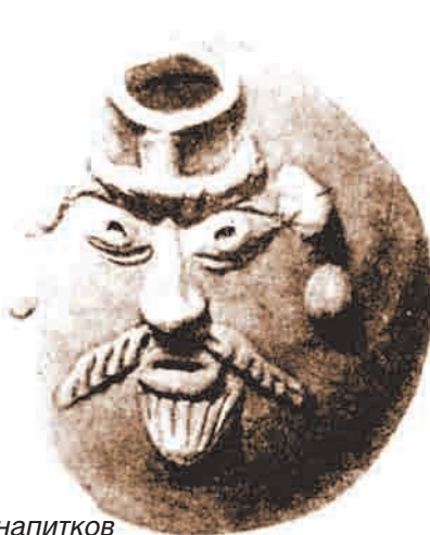
Сосуды для хранения ритуальных напитков и лекарств. V в. до н.э. Кавказская Албания