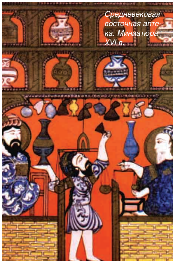
Средневековая восточная апте- ка. Миниатюра XVI в.

происходившей из карабахского ханского рода. Карабаги обладал крупной коллекцией более чем 150 средневековых восточных рукописей по медицине. Ему принадлежит много рекомендаций по медицине и косметологии. Например, для того, чтобы уберечь кожу от загара, он рекомендовал смазывать ее обычным яичным белком. Для улучшения пищеварения и повышения секреции желудочного сока и желчи