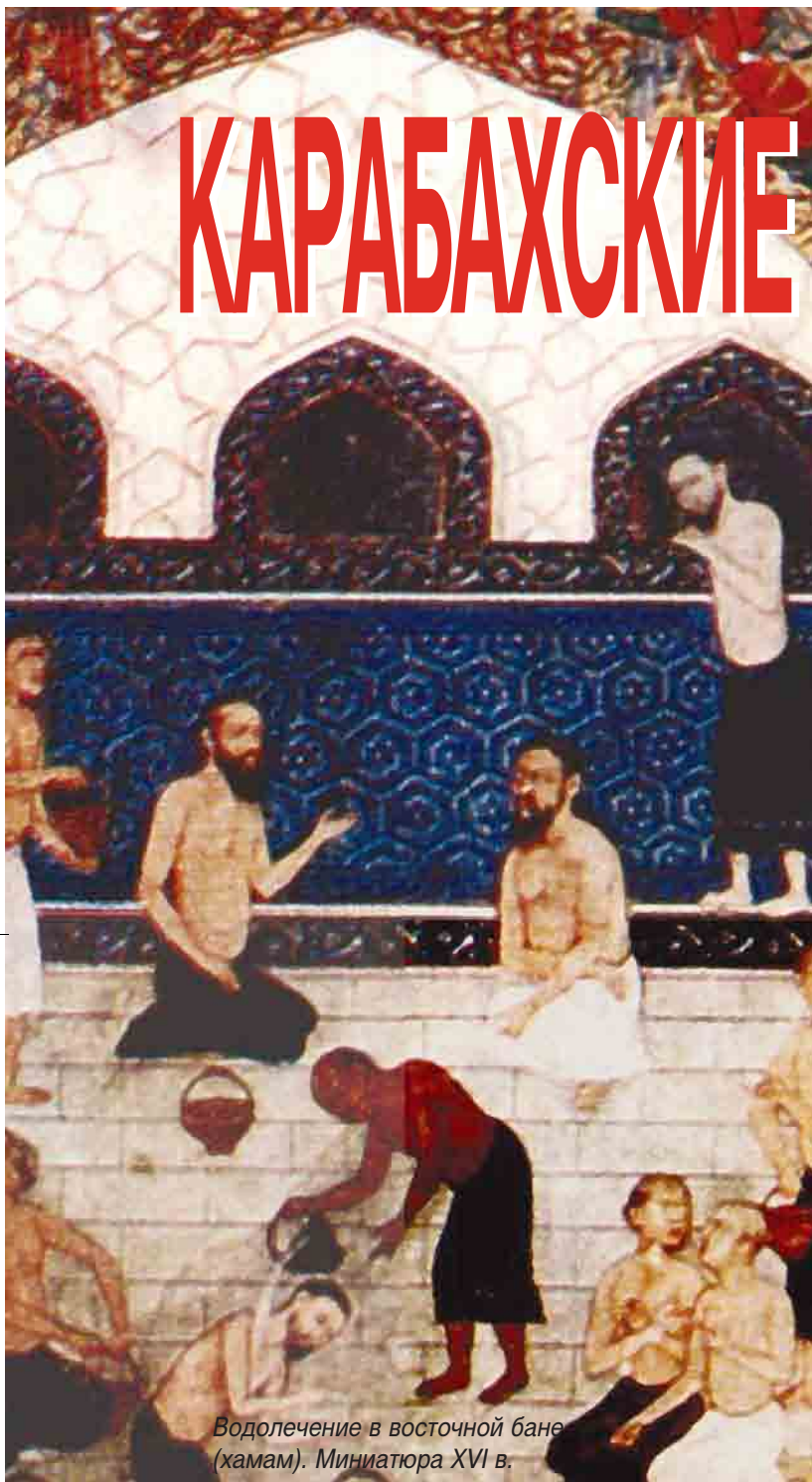
Водолечение в восточной бане (хаммам). Миниатюра XVI в.

Еще в первые века нашей эры в Кавказской Албании стало распространяться христианство, благодаря которому в этот край проникли сирийская и греческая медицина. Тогда в Карабахе существовали албанские церковные школы, где ученики могли познакомиться с трудами таких великих античных врачей, как Гиппократ и Гален. Большую роль в развитии медицины в Карабахе в IV –V вв. сыграли врачи-несториане, бежавшие в Кавказскую Албанию из Сирии, Греции и Ирана от преследований в