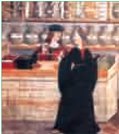
Итальянская аптека XV века. На полках стоят сосуды с лекарствами, изготовленными из трав, завезенных из Азербайджана, Центральной Азии и Индии. Настенная фреска. XV в.