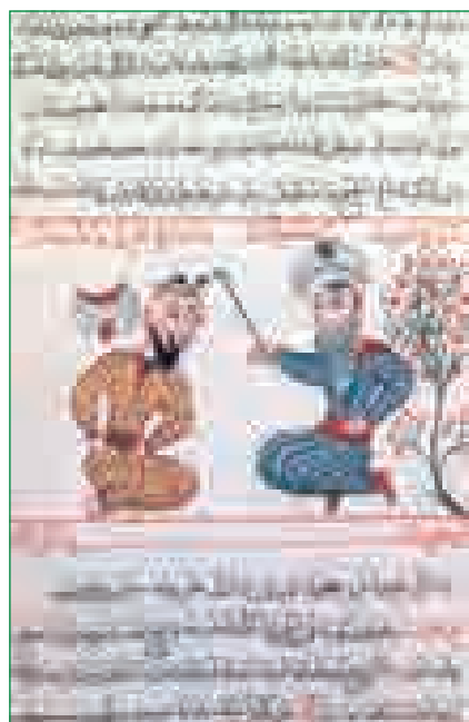
Прижигание точек на голове. Рисунок из “Трактата по хирургии” (1469 г.). Книга была написана на азербайджанском (тюркском) языке Шарафаддин Хакимом и ныне хранится в Музее Топкапы в Стамбуле.

В средние века профессиональную медицину Востока в Азербайджане именовали словом “тибб” (“медицина” - араб.). Медресе (высшие учебные заве-