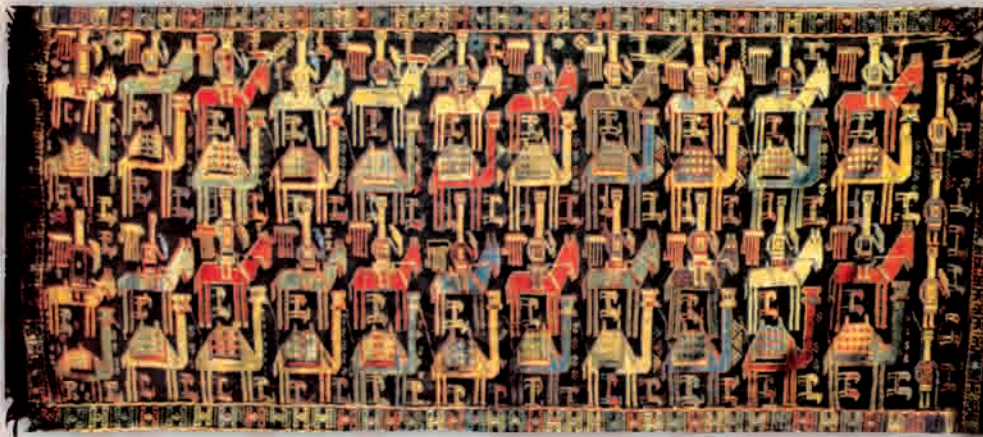
Шадда. Сюжетный безворсовый ковер "Караван", XVII в.

ров "Сахсыда гюльяр" и "Бахчада гюльяр" считаются шедеврами карабахских ткачих.