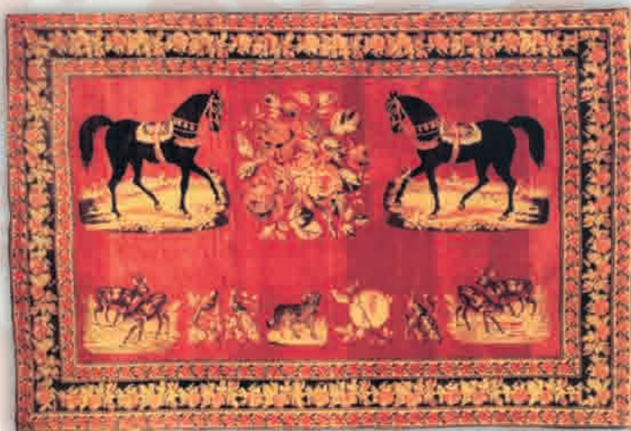
Сюжетный ковер "Атлы-утли", XIX в.

По композициям узоров карабахские орнаментальные ковры делились на две типологические группы - "хончасыз" и "хончалы", т.е. с медальонными узорами и без них.