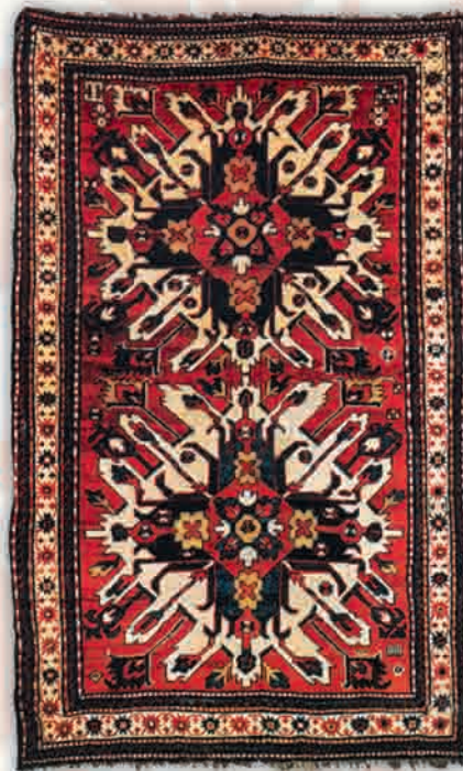
Ковер "Челеби", XIX в.

Мужчины занимались стрижкой весенней шерсти или ее покупкой на эйлагах (летних пастбищах), а на долю женщин приходилось мыть шерсть, сушка, расчесывание, прядение, крашение и, наконец, собственно изготовление ковров и ковровых изделий. Даже нити для ворса ("ильме") очень часто красили сами ткачихи. Высоко ценились в ковроделии краски, полу-