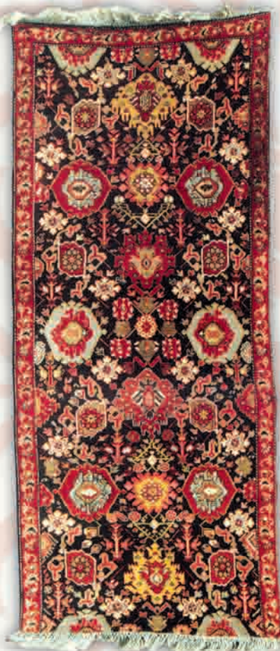
Ворсовый ковер "Годжа" конец XVI-нач. XVII в.

Одним из традиционно развитых видов ремесла являлось ковроткачество, принесшее Азербайджану мировую славу. Она делится на ряд региональных производственных центров. К таким ярким центрам, изделия которого отличаются своим разнообразием, красотой рисунка, яркостью узоров, композиционной целостностью и прочими художественными достоинствами, относится край чарующей природы, один из райских уголков нашей страны - Карабах.