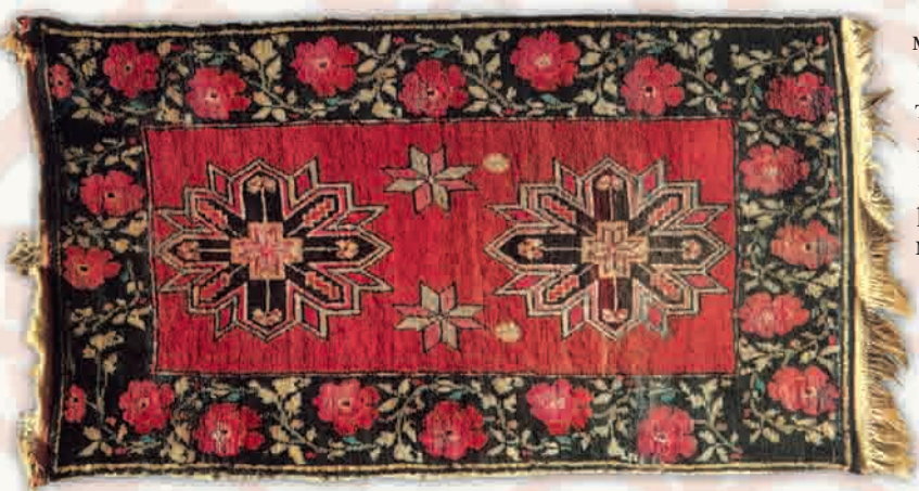
Ковер "Шуша", XIX в.

Геба - ковры несколько короче халы, но шире его, были широко распространены во всем Азербайджане, в том числе в Карабахе.