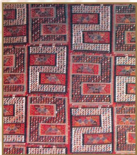
Фрагмент безворсового ковра "Верни", XIX в.

Чул - разновидность коврового изделия для коней знатных людей, передняя часть которого заканчивалась парными крыльями. Чул набрасывали на коня в холодную погоду или после долгого пути. Иногда чул изготовляли и для верблюдов.