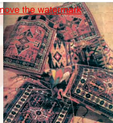
Хурджуны (переметные сумы) нач. XX в.