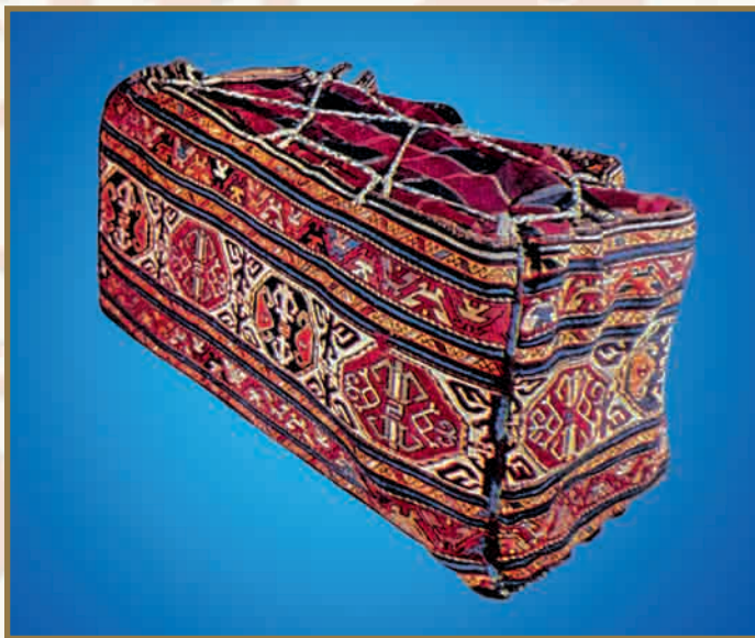
Мафраш (Ковровый сундук), XIX в.

На стремительное развитие ковроткачества в Шуше и окрестных с ней селах оказал влияние возникший в зарубежных странах в 1879-1880 годах большой интерес к коврам со старинными узорами. Именно поэтому карабахские ковры попали в Европу и Америку, хранятся в известных музеях мира. ❁