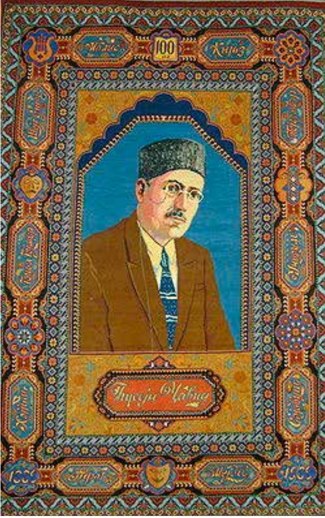
Hüseyin Cavid. Hali üzerinde portre