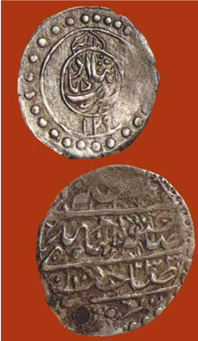
Karabağ Hanlığı, anonim, Penahabad, Hicri 1199 yılı, Abbasi, gümüş

dından keskin şekilde farklı olmasıydı. Abbasinin nominal değeri 200 bakır dinara eşitti, ancak onun ağırlığı zamanla bozularak gösterilen dönemde – XVIII yüzyılın ortalarında 2,5-3,0 gr olmuştur. Ancak bugün, Azerbaycan Milli Bilimler Akademisi Tarih Müzesinin Nümismatik ve Epigrafi bölümünün Nümismatik fonunda bulunan 23 Panabadi örneği 5,2 gramdır ki, bu da, 5,46 gr olan 28 nohut ve 7 dangaya (bir dirhemin altıda biri) tekabül eder. Panabadinin, abbasiden iki kat ağır olduğunu fark etmek hiç de zor değil. Bu bağlamda, Panabadinin nominal değerinin belirlenmesi konusu da dikkat çekicidir. Yine de Ahmed bey Cavanşir'e göre, Panabadi (parite açısından) yaklaşık 5,0 gr ağırlığındaki Rus gümüş 15 ka-