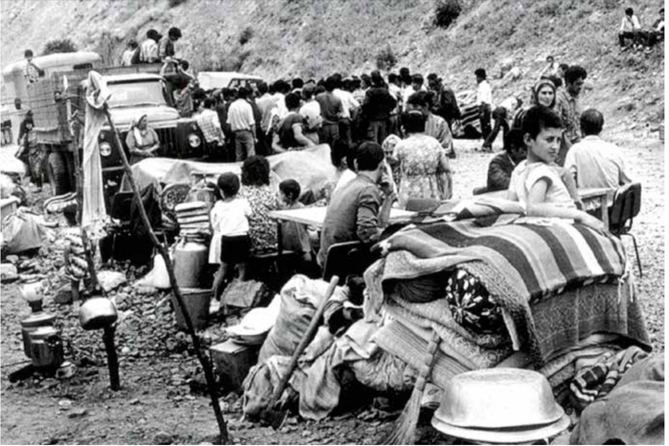
Azerbaycanlıların Ermenistan'dan kovulması. Azerbaycanlıların kendi vatanlarından göçe zorlanmasının son aşaması böyle tamamlandı

kü'de efsanevi «Ermeni katliamını» düzenleyemezdi.