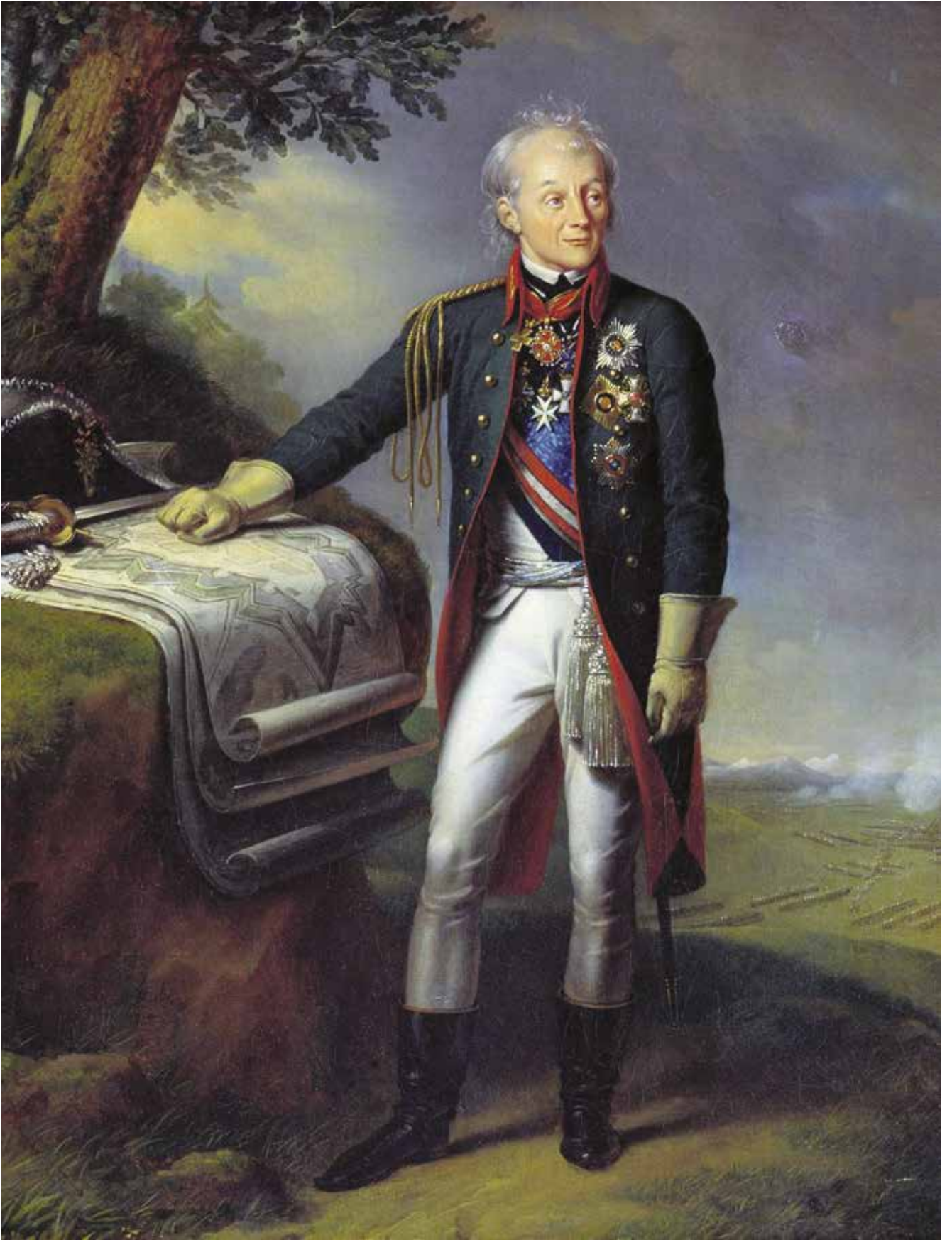
Ressam K.Şteyben. A.V.Suvorov'un portresi. 1815