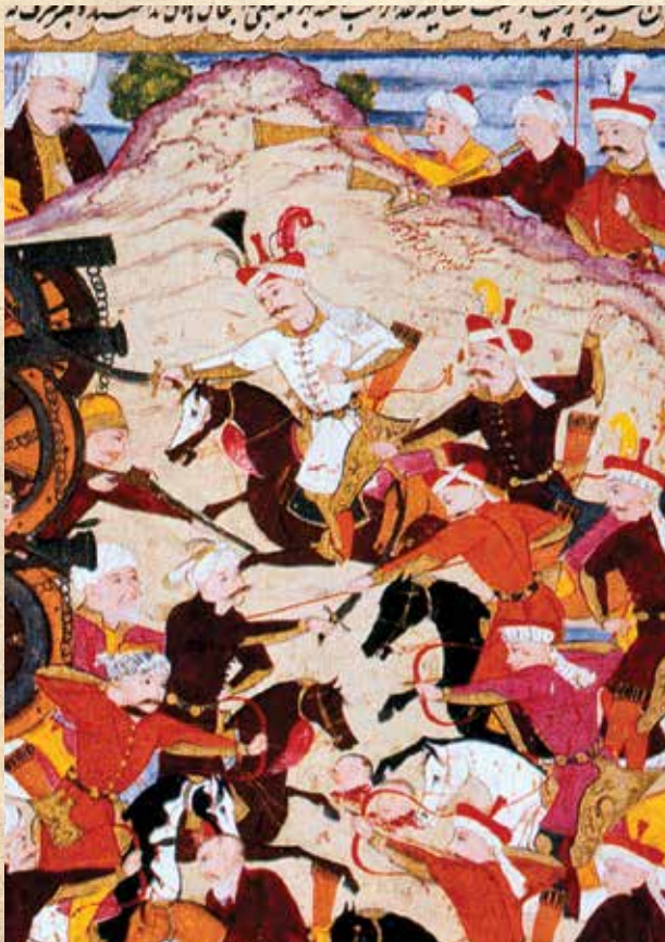
Мир Зейналабдин. Чалдыранская битва

Исмаила II Мухаммеде Худабенде (1578—1587) и Аббасе I (1587—1628). Последний окружал себя мастерами изящных искусств и имел библиотеку, которой руководил вначале вышеупомянутый художник и поэт Садиг-бек Афшар.