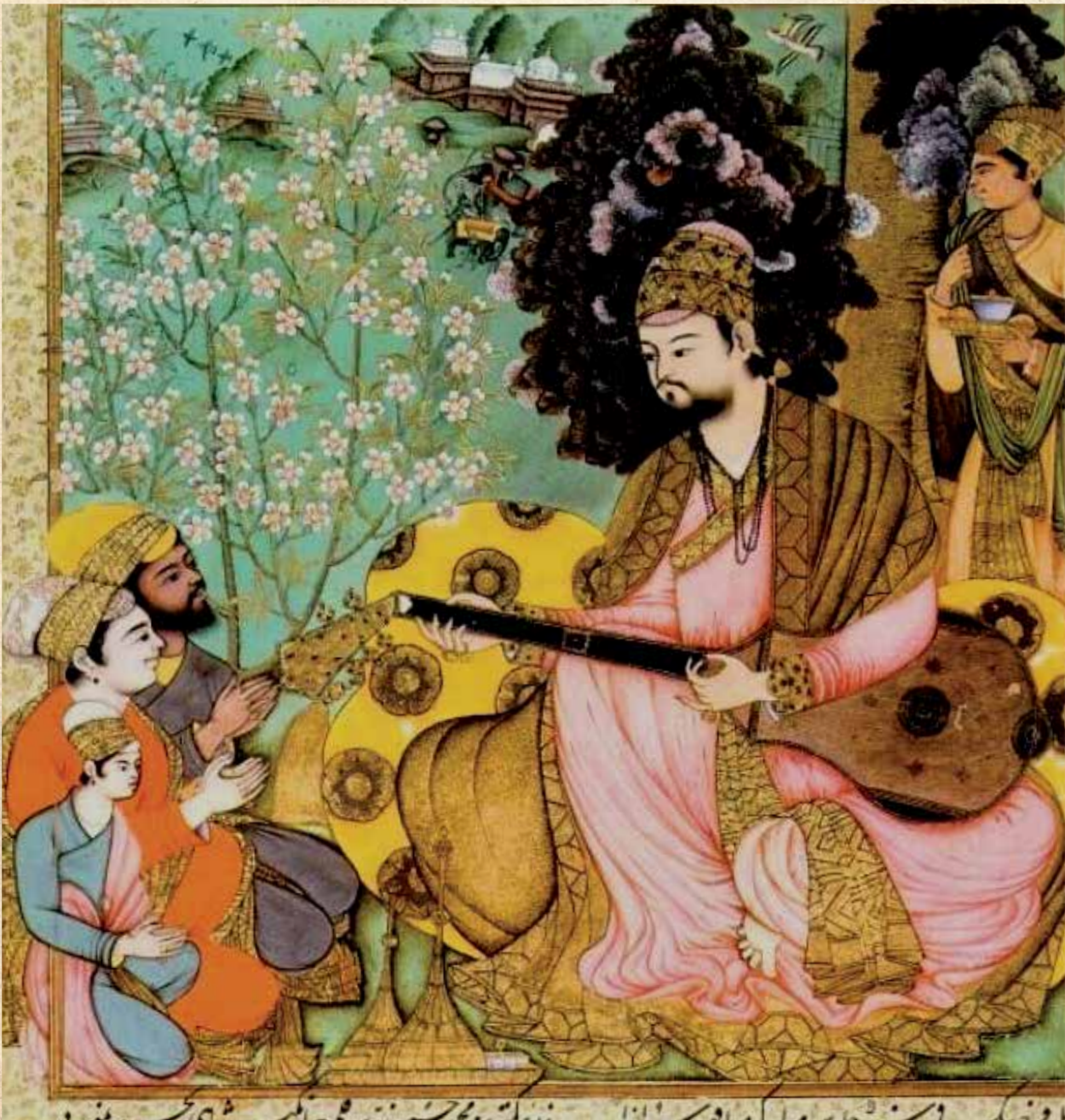
Фаррух-бек. Ибрагим Адилшах музицирует. 1610-1611 гг.. Музей Напрстек, Прага.