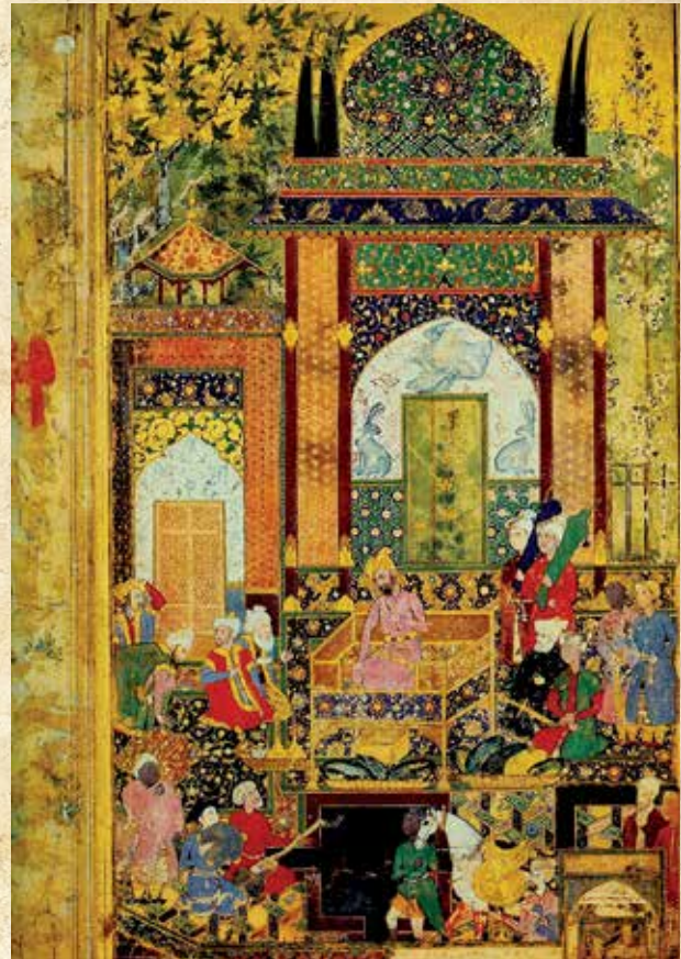
Фаррух-бек. Бабур принимает придворных. Бабурнаме. 1589 г..

Подобно первым сефевидским шахам — Исмаилу I, Тахмасибу I и принцу Бахраму-мирзе, сохранившим соответственно в Тебризе, Казвине и Герате библиотеки со штатом известных мастеров по различным видам художественного творчества, Ибрагим-мирза имел в Мешхеде роскошную библиотеку с художественными мастерскими (1, с.6). Здесь сосредоточились значительные художественные силы, как это подтверждает близкий ко двору Ибрагима-мирзы историк Кази Ахмед. Он писал, что большую библиотеку содержал в Мешхеде и сын Бахрама-мирзы султан Ибрагим-мирза; в ней работало большинство ведущих мастеров письма, художников, ор-