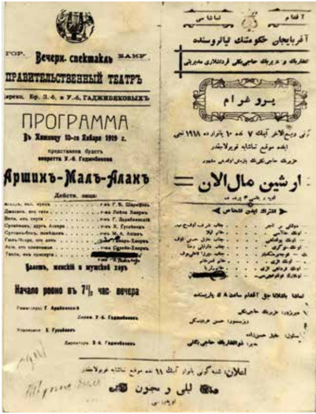
برنامج عرض الأوبريت في ١٩ يناير لعام ١٩١٩ في باكو.

المسرح مع الأخذ في الاعتبار بالمتطلبات الجديدة المتنامية. ففي البداية كان الرجال فقط هم رواد المسرح، و فقط في عام 1906 تم افتتاح مقصورات خاصة بالنساء تحجبها الستائر. وفي 25 يناير لعام 1908 جرى هنا تحديدا عرض أوبرا أوزير حاجي بيكوف "ليلي والمجنون" - أول أوبرا مكتوبة في العالم الإسلامي بأسره.