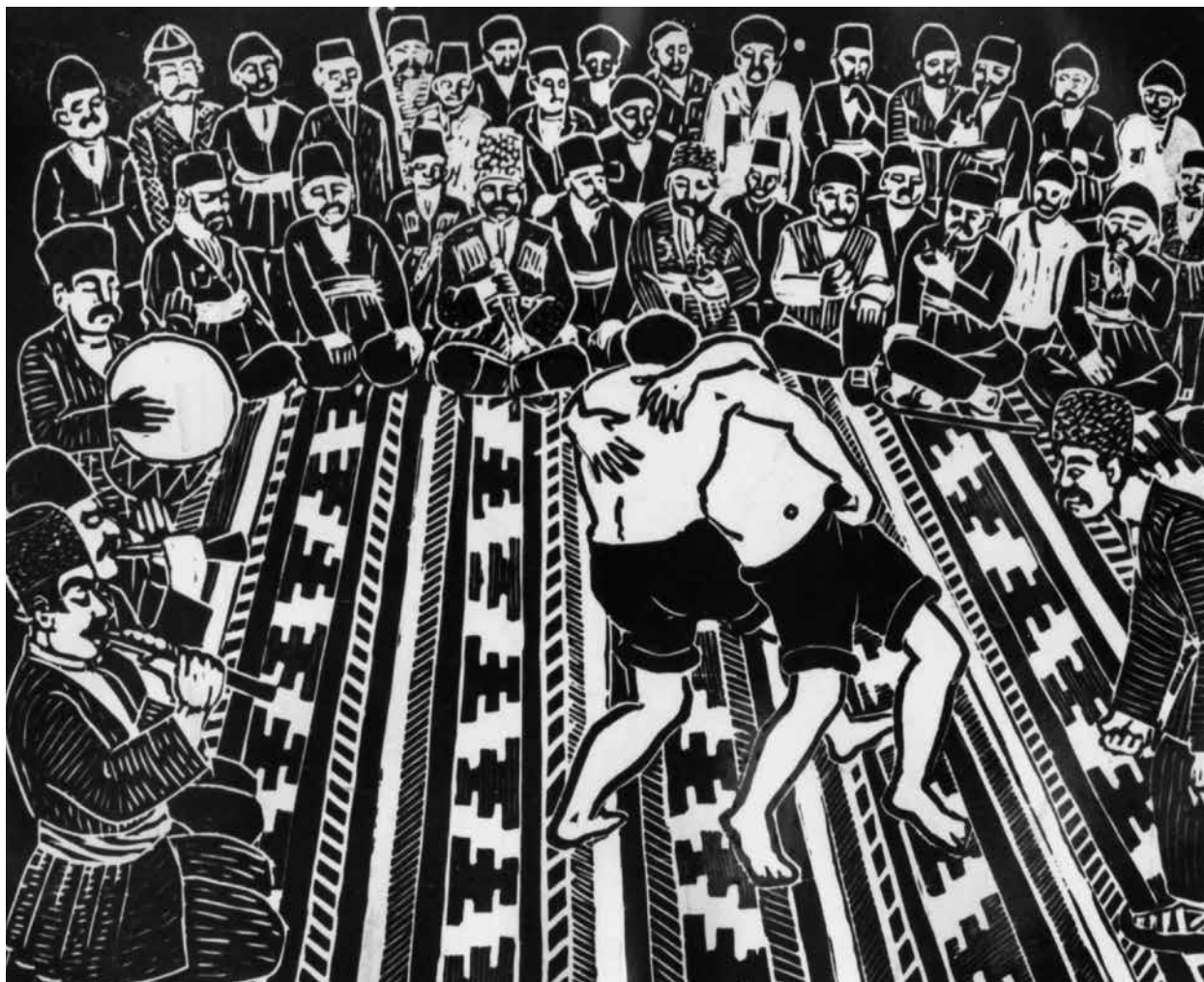
Гюлеш (вид национальной борьбы). Художник Э.Рзагулиев

В позднее средневековье обязанности муршуда и музыканта стал выполнять один человек. Некоторые функции муршуда выполнял мияндар , который стоял посередине, и по его знаку под звуки думбула приступали к разминке. В некоторых случаях в зорханах, кроме думбула, играли также в гоша-зурна и балабан.