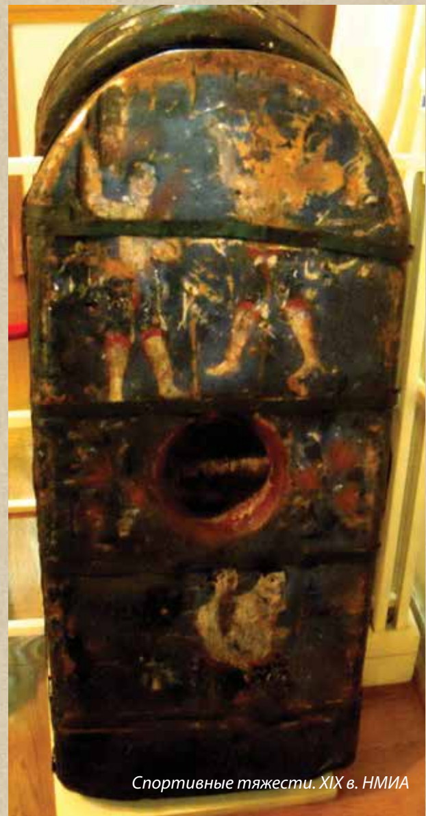
Спортивные тяжести. XIX в. НМИА

Човган был настолько популярен в Азербайджане, что упоминается в своих произведениях многих известных поэтов начиная со средневековья. Великий азербайджанский поэт Низами Гянджеви, опираясь на исторические документы, писал, что последний ахеменидский царь Дарий,