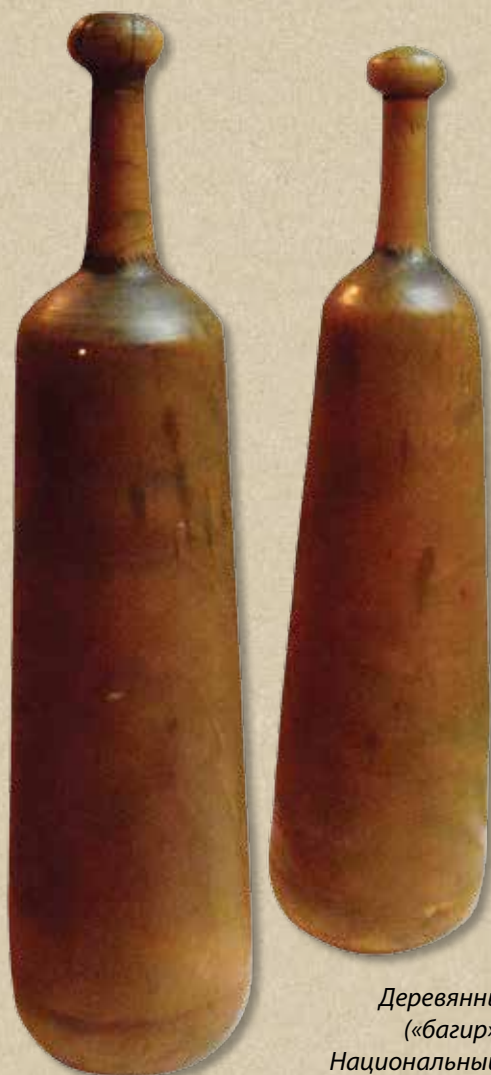
Деревянные гири («багир»). XIX в. Национальный музей истории Азербайджана

Вода служила для первобытных людей второй по значимости жизненной средой. В изобразительном искусстве древности часто встречаются рисунки лодок с экипажами, вооруженными длинными палками. Это говорит о том, что люди занимались рыбной ловлей, а следовательно, и плаванием.