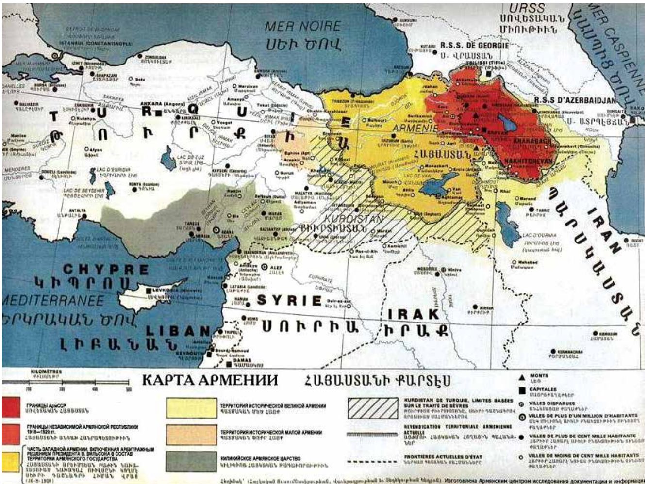
„Mapa Arménie“ sestavená současnými arménskými „badateli“ a dokumentující bezbřehé ambice arménských šovinistů

v Gruzii. O expanzionistických pletichách arménských nacionalistů vůči Gruzii psal již na počátku 20. století ruský publicista V. L. Veličko, který poukazoval na zničení gruzinských historických a architektonických památek, na vymazání starověkých gruzinských nápisů a jejich nahrazení arménskými, na armenizaci pravoslavných chrámů, krádeže gruzinských ikon a jejich přemístění do arménských kostelů (14, str. 68). Obdobné aktivity zavdávaly pak jistě důvody k územním nárokům vůči sousední zemi.