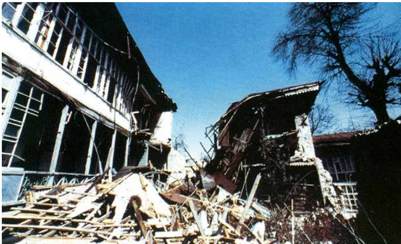
Město Šuša po okupaci ozbrojenými silami Arménie, současné foto

Arménů, zatím si z Tiflisu nikam neodskočil, vykřikoval: „Není pochyb, Ráj byl tady, v Arménii! ‘ Takto tedy přesvědčili evropského dopisovatele, že Gruzie, včetně Tiflisu, je Arménie, a přiměli jej šířit tuto zvěst po celém světě prostřednictvím takových vážených a vlivných novin, jako jsou ‘ Temps ‘! “ (3, str. 39-43).