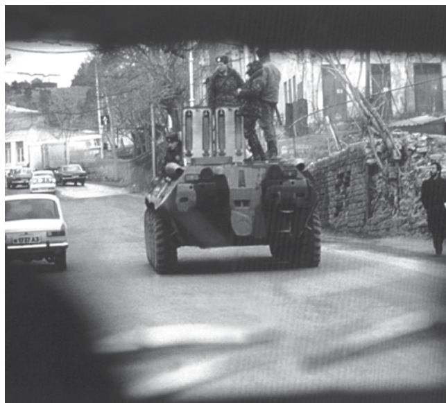
Sovětská vojska v ulicích Baku

dalších regionech“ ze dne 15. ledna 1990, a to zejména článek 7, který navrhoval zavést v Baku a Gjandže zákaz vycházení (5). V Ázerbájdžánu vyhodnotili toto nařízení jako další projev proarménské postoj svazového ústředí, a to tím spíše, že o vyhlášení mimořádné situace na území Arménie, která byla bezprostředním zdrojem destabilizace situace v regionu, nepadlo v dokumentu jediné slovo.