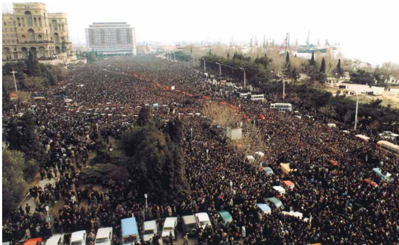
Na pohřeb obětí událostí z 20. ledna 1990 přišlo více než milión občanů. Tyto události urychlily vystoupení Ázerbájdžánu ze svazku SSSR.

UDÁLOSTI Z 20. LEDNA 1990 JSOU JEDNÍM Z HISTORICKÝCH MEZNÍKŮ MODERNÍCH DĚJIN ÁZERBÁJDŽÁNU. TYTO UDÁLOSTI NASTALY V DŮSLEDKU SLOŽITÝCH GEOPOLITICKÝCH JEVŮ, KTERÉ PROBÍHALY NA ÚZEMÍ SVAZU SOVĚTSKÝCH SOCIALISTICKÝCH REPUBLIK (SSSR). NA KONCI 80. LET 20. STOLETÍ DOSÁHLY ROZKLADNÉ PROCESY V SSSR SVÉHO VRCHOLU, COŽ BYLO V NEMALÉ MÍŘE ZPŮSOBENO VÝZNAMNOU AKTIVIZACÍ NÁRODNÍCH Hnutí VE SVAZOVÝCH REPUBLIKÁCH. ZEJMÉNA V POBALTSKÝCH A ZAKAVKAZSKÝCH REPUBLIKÁCH NABYLA TATO Hnutí MASOVÉHO CHARAKTERU, PODOBNĚ JAKO V MOLDAVSKU. NÁRODNÍ Hnutí V TĚCHTO REPUBLIKÁCH, VČETNĚ ÁZERBÁJDŽÁNU, BYLA PŘEDEVŠÍM ORIENTOVÁNA NA BOJ ZA SUVERENITU.