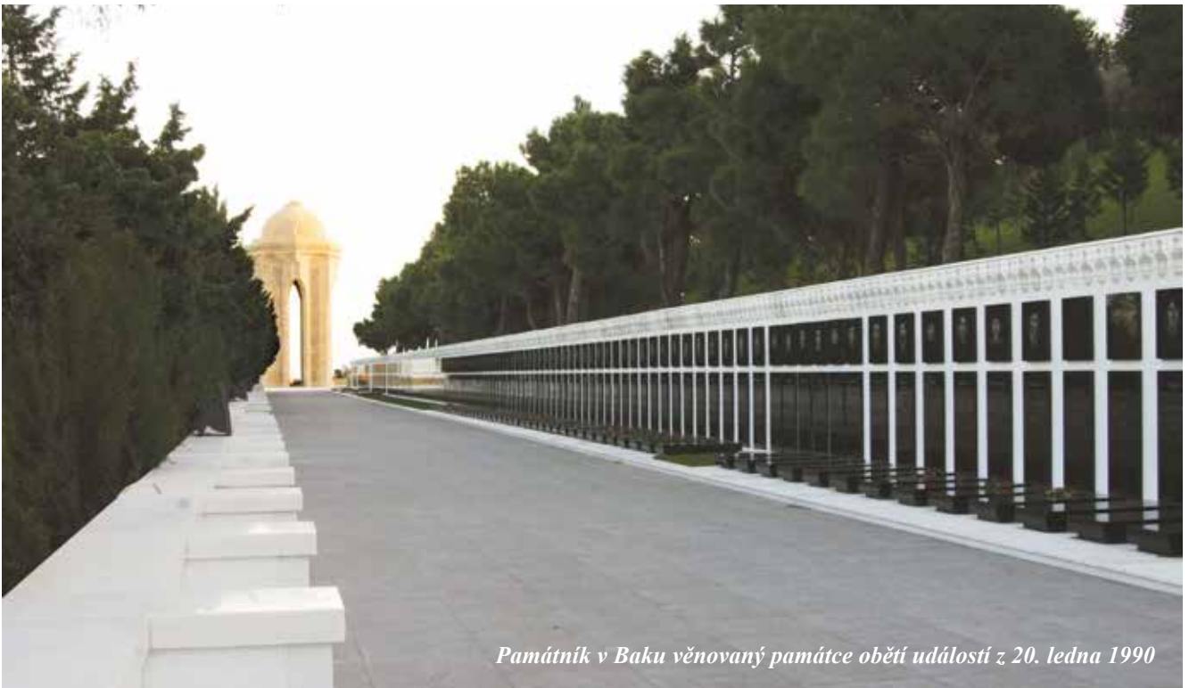
Památník v Baku věnovaný památce obětí událostí z 20. ledna 1990

Není pochyb o tom, že touto kárnou akcí svazové ústředí dosáhlo určitých taktických úspěchů, konkrétně vyhlášením mimořádné situace dokázalo dočasně stabilizovat situaci v Ázerbájdžánu a na post prvního tajemníka místního ÚV dosadit svoji další loutku. Nicméně ze strategického hlediska svazové vedení utrpělo dokonalé fiasko, protože události z 20. ledna 1990 byly začátkem konce sovětského komunistického režimu v Ázerbájdžánu.