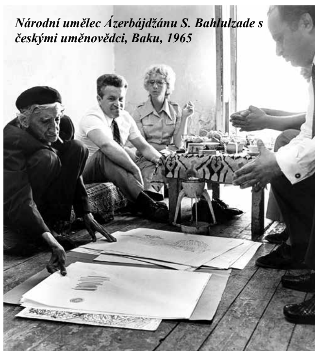
Národní umělec Ázerbájdžánu S. Bahlulzade s českými uměnovědci, Baku, 1965

S. Bahlulzade odjel do Prahy se svým blízkým přítelem, národním umělcem Ázerbájdžánu Torgulem Narimanbekovem. V rozhovoru s autorkou článku Narimanbekov vzpomínal na okolnosti uspořádání výstavy: „Byla to ohromná událost, v té době byl