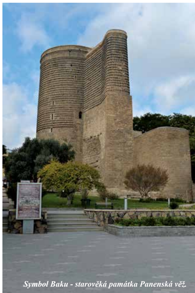
Symbol Baku - starověká památka Panenská věž.

Základy věže byly vybudovány přibližně v 5.–6. století, horní část pak ve 12. století. Účel Gyz-Galasy je též předmětem urputných diskusí. Někteří badatelé se domnívají, že původně byla budována jako chrám ohně a její výška byla dána tím, že Zoroastriáni 8 praktikovali krajně neobvyklý způsob pohřbívání mrtvých (těla