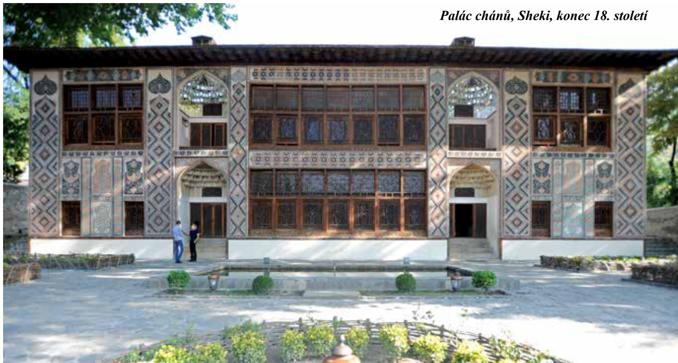
Palác chánů, Sheki, konec 18. století

Každým rokem se v závodě stáčí stovky tisíc lahví vína, které se prodává téměř v každé ázerbájdžánské prodejně. Přitom samotný vinařský závod začíná mít v poslední době spíše charakter lázeňského střediska. Vedle stáčíren zde svítí bílou barvou dvoupatrové rodinné domky, dokončují se bazény, tenisové kurty,