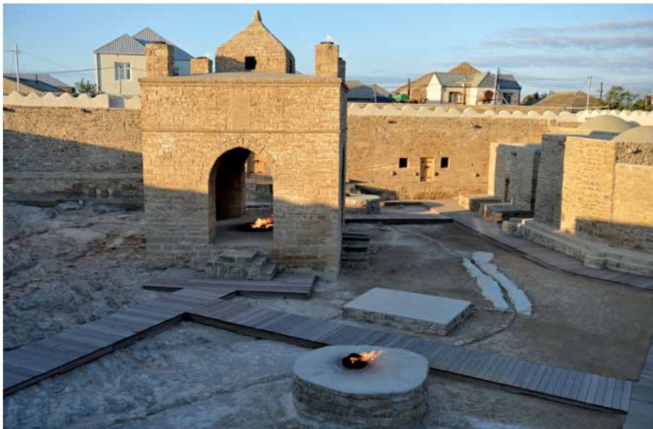
Chrám uctívání ohně, Surakhany (okolí Baku). 17 století

starodávné pevnosti a osídlení a na jejich místě zřídili historicko-etnografický park se stovkami exponátů z různých období – od hrubě opracovaných pracovních nástrojů doby kamenné a desek pokrytých petroglyfy, až po elegantní kočáry z 19. století.