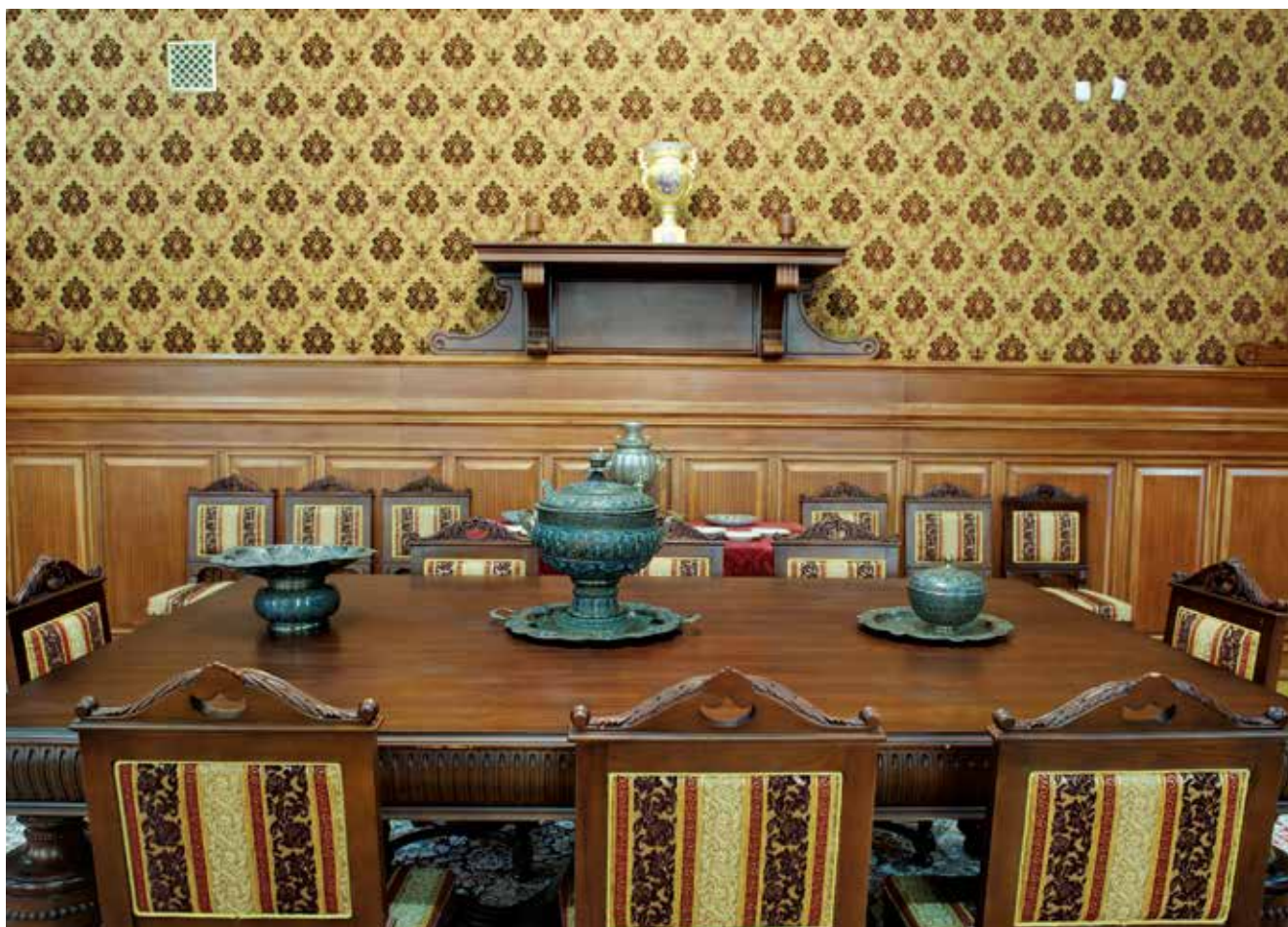
Expozice Národního muzea dějin Ázerbájdžánu, východní sál muzea-obydlí H. Z. Tagijeva

v roce 1955 a s periodicky prováděnými změnami a doplňováním fungovala až do obnovy nezávislosti republiky v roce 1991. V Muzeu dějin také pracovala skupina, která díky svojí činnosti v oboru podmořské archeologie byla naprosto jedinečnou a která prováděla vykopávky v pobřežních vodách Kaspického moře a pobřežním pásu.