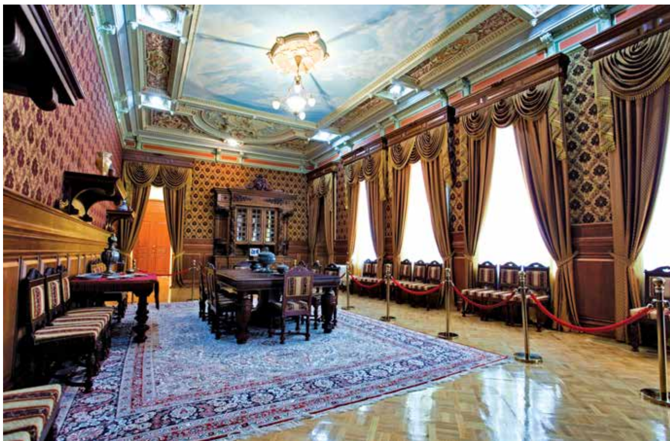
Expozice Národního muzea dějin Ázerbájdžánu, východní sál muzea-obydlí H. Z. Tagijeva

Dějiny období ázerbájdžánských feudálních států, jakými byly říše Širvanšáhů, Sádžidů, Salaridů, Šeddadidů a Atabeků se promítají v detailech architektonických objektů, v epigrafických a numismatických památkách. V přízemní expozici jsou vystaveny skvělé ukázky glazované keramiky z archeologických vykopávek