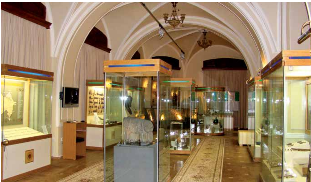
Expozice Národního muzea dějin Ázerbájdžánu, oddělení středověkých dějin Ázerbájdžánu

z Gamigaje v Nachičevanu vyprávějí o duchovním životě našich předků. Velký zájem vzbuzují hliněné sošky býka, trojnožky, nádoby ve tvaru vysokých bot, hliněné modely krytých vozů, kamenné formy na odlévání bronzu, bronzové zbraně z doby unikátní Kuro-arakské archeologické kultury. Pozornost poutají džbány nejvyšší umělecké úrovně z období Nachičevanské a Chodžali-gedabejské archeologické kultury. Doba železná je zastoupena zbraněmi a pracovním náradím, antropomorfními soškami, zoomorfní keramikou, hliněnými pečetěmi, které sloužily jako uzávěry nádob a byly nalezeny v mohylových hrobech, urnových a podzemních pohřebištích. Spony skytských bronzových pásů se zvířecími motivy, bronzové symboly moci – soška jelena a kamzíka, stříbrná nádoba, skytské hroty šípů, dovezená pečetidla válcového tvaru – to vše svědčí o usazení kimersko-skytsko-sakských kmenů v Ázerbájdžánu, o vzájemných vztazích mezi skytskými říšemi a sousedními státy Mannou a Médii. Exponáty pozdějšího období demonstrují politickou a ekonomickou situaci v suverénních státech Ázerbájdžánu – Atropatene a Albanii. Zlaté, stříbrné, skleněné, bronzové ozdoby, terakotová pečetidla, kamenný podstavec chrámu a lampy s albanskými nápisy, sasanidské mince vyražené v ázerbájdžánských městech svědčí o zbožně peněžním hospodářství a zahraničních stycích Ázerbájdžánu v období antiky a raného středověku.