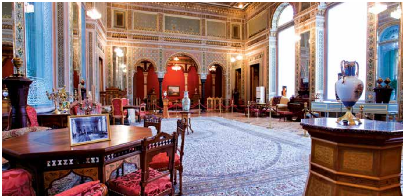
Expozice Národního muzea dějin Ázerbájdžánu, východní sál muzea-obydlí H. Z. Tagijeva

Samostatná část je věnována ukázkám lidové tvořivosti – domácího náčiní, užitého umění; ve vedlejším výstavním sále jsou koberce, hedvábné látky, výrobky tkalcovského řemesla. V dalších sálech jsou vystaveny exponáty věnované obchodu a ekonomice – předměty vývozu a dovozu, zařízení a dokumenty železniční dopravy, rybolovu, lodního stavitelství. Mimořádný zájem vyvolávají lidové hudební nástroje, osobní předměty vědeckých osobností, představitelů osvěty a kultury. V sálech věnovaných účasti Ázerbájdžánu v revolučním hnutí jsou prezentovány krušné události počátku 20. století. V sálech 1. světové války poutají pozornost osobní předměty a dokumenty ázerbájdžánských lékařů, důstojníků a generálů – účastníků války.