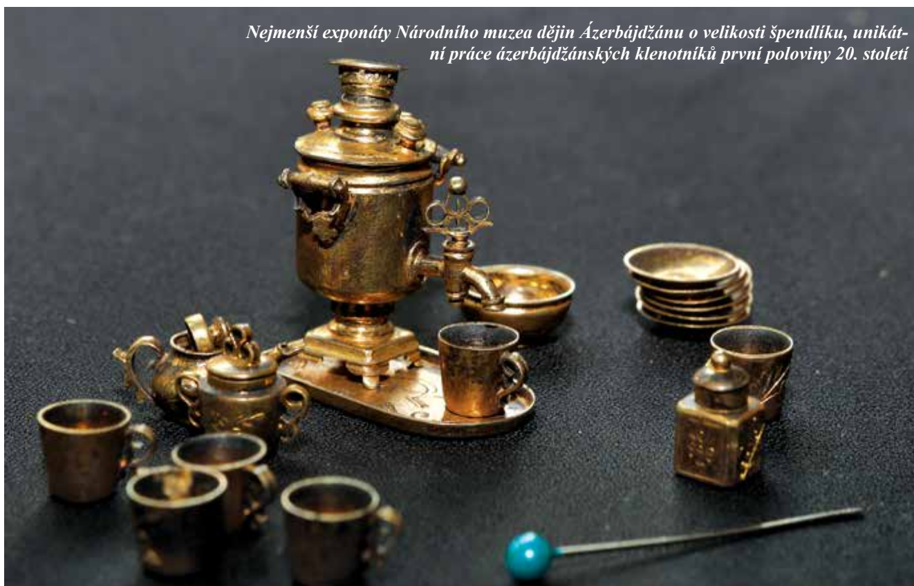
Nejmenší exponáty Národního muzea dějin Ázerbájdžánu o velikosti špendlíku, unikátní práce ázerbájdžánských klenotníků první poloviny 20. století

V muzejní expozici je věnováno hodně prostoru době bronzové (před 5-2 tis. lety). Exponáty zde vystavené – petroglyfy z Apšeronu, skalní malby