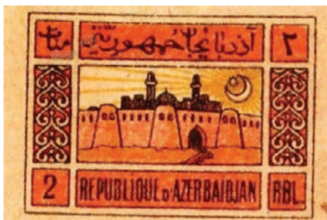
Serie di francobolli "Iceri Sheher". 1919. Museo Nazionale di Storia dell'Azerbaijan (MNSA).

A seguito di un'ordinanza del Governo della Repubblica, il Ministero delle Poste e Telegrafi iniziò la preparazione e l'emissione di questi francobolli già nel giugno del 1919. La prima notizia di questo evento venne pubblicata sul giornale "L'Azerbaijan", nel quale venne scritto: "Il Ministero delle Poste e Telegrafi emette dei francobolli di nuovo formato. I francobolli saranno decorati con motivi orientali e con disegni di diverso tipo: un soldato con la bandiera azerbaijana, un contadino con una falce ("terra e libertà"), le Surahan ("fiamme ardenti") ed una fortezza. I francobolli saranno emessi nei