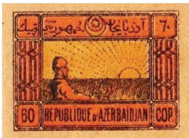
Serie di francobolli "Contadino", 1919 MNSA