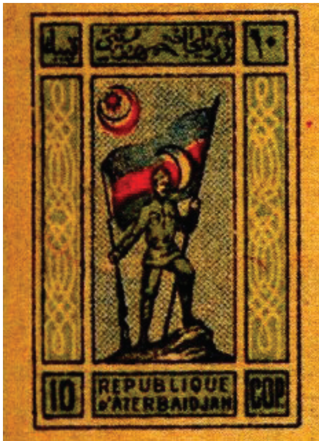
Serie di francobolli il "Guerriero con una bandiera", 1919. MNIA

Nel periodo delle prime emissioni i tagli dei francobolli furono aumentati sino a 10. Il 28 Agosto del 1919 venne pubblicata sul giornale "Azerbaijan" la notizia della creazione di nuovi francobolli da 50 rubli. (4, pag. 2). Ciò era dovuto al repentino aumento delle tariffe postali. I funzionari del Ministero delle Poste e Telegrafi presero una decisione assolutamente saggia nell'inserire un taglio aggiuntivo prima che l'aumento delle tariffe postali e telegrafiche fosse annunciato ufficialmente.