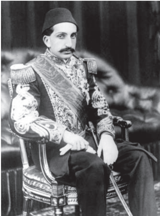
Sultan II Abdülhamit döneminde Avrupa ülkeleri Ermeni meselesinin propagandasını yapmıştı

1875-1878 yıllarında Şark krizinin sona ermesi Osmanlı İmparatorluğu için Balkan yarımadasının büyük bir kısmında yüzyıllar boyu devam eden yönetimini sona erdirdi. Diğer taraftan olayların gidişatı Balkanların elden çıktığını ortaya koydu. Batı diplomasi için burası Bab-i Ali üzerinde önemli bir baskı aracıydı. Berlin Kongresi açık şekilde şunu gösterdi: Büyük güçler bu defa Osmanlı'nın iç işlerine müdahale için "Ermeni Sorununu" bir