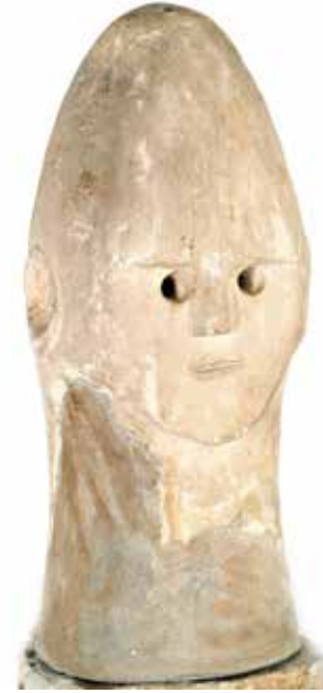
Deforme kafatası şeklindeki taş heykel. M.Ö. 1. yy. Azerbaycan'ın Tovuz bölgesi Garibli antında ortaya çıkarılmıştır. Azerbaycan Milli Tarih Müzesi

Ermenistan tarafından toprak iddialarının etnik kökeni ile ilgili olarak akademisyen R.Mehdiyev bir dizi belgesel ve bilimsel kanıtlarla, Ermenilerin siyasi çizgisine yazılan sözde “tarihi” gerçekleri yalanlamaktadır.