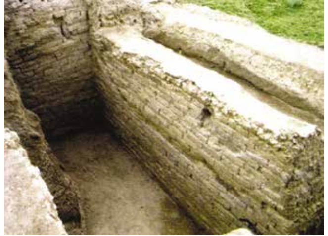
Ortaya çıkarılan eski yapıların üzerinde koruma çalışmaları yürütmek çok önemlidir. Şemkir bölgesindeki Ortaçağ yapısında kemerli tavanın korunması

Azıhantropolar zihinsel gelişimin belli bir seviyesine ulaşmış, nispeten zengin bir iç dünyaya sahiptiler. Azıh sakinleri tarafından yapılan en eski eşyalar – kava şeklinde yapılmış satırlar ve aynı zamanda, kazma kesme ve diğer emek faaliyeti için gerekli taş parçalarından yapılan araçlardır. Barınakları kayaaltı mağaralarda yerleşiyordu. Dünya bilimsel topluluğu, azıhantropu dünya antik sıralamasında 4. olarak tanımıştır.