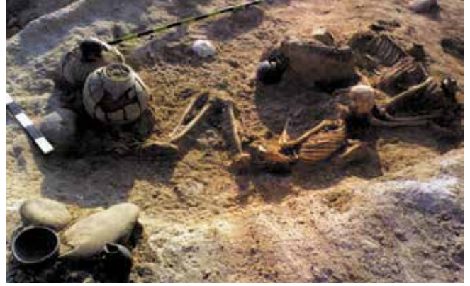
Eski mezar kazılarında önemli bulgular ortaya çıkarılmıştır. Fotoğrafta - Azerbaycan'ın Goranboy bölgesindeki Boncuk tepe Nekropolünde bulunan Tunç Devrine ait 32 mezardan biri

bazı "tarihsel gerçekler" delil olarak gösterilerek açık toprak iddiaları ileri sürülüyor. Saldırgan Ermeni milliyetçiliği ideologları tüm yöntemlerle dünya kamuoyuna "denizden denize Ermenistan" fikrini kanıtlamak için tasarlanmış, bilimle ilgisi olmayan saçma uydurmalarını kabul ettirmeye çalışıyor. Akademisyen R.Mehdiyev "Gorus-2010: saçma tiyatro sezonu" eserinde haklı olarak "Bilimin siyasi amaçlara (mitlere) hizmet etmesinin normal bir durum olduğu ülkede, devlet başkanının Gorus'ta seslendirdiği benzeri açıklamalar yapmasının da mümkün olduğunu" not düşüyor. R.Mehdiyev, bölgede yaşanmış ve yaşanmakta olan tarihi olayları objektif olarak değerlendirerek, bilimsel olarak ve çok sayıda yabancı kaynakları kullanarak Ermeni hegemonik saçmalıklarını ifşa etmektedir. Bir vatandaş, bilim adamı, ideolog olarak görevinin gerçekleri yansıtmayı olduğunu düşünen akademisyen, Ermeni saldırgan bölücülüğünün gerçek hedef ve yöntemlerini ifşa ediyor: "Bilimin mitlere ve dış siyasetin amaçlarına hizmet etme çabaları içinde olan Ermeni tarih bilimi zaman-zaman saçmalamaktadır" 18 .