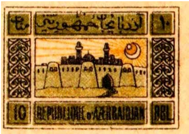
Kale ("Şirvanşahlar sarayı") posta pulu serisi. Azerbaycan Milli Tarih Müzesi.

1919-1920 yılları Azerbaycan Cumhuriyeti Halk Konseyi ve 1921-1923 yılları Azerbaycan SSC'nin kağıt paraları, senet ve diğer damga kağıtları bastırılmıştır (5, s. 20). Posta departmanının siparişleri para birimlerinin bastırıldığı aralıkta yerine getirilmekteydi. Kromolitografi, Karantinniy ve Krasnovodsk (şimdiki Samed Vurgun ile Hezi Aslanov sokakları) sokaklarının kesiştiği yerde bulunan Merkez Bankası'nın yanında yerleşiyordu. Eski litografi, daha sonralar ise "Krasniy Vostok" matbaası 1991 yılına kadar amacına yönelik faaliyet göstermiştir (5, s. 20; 7, s. 42).