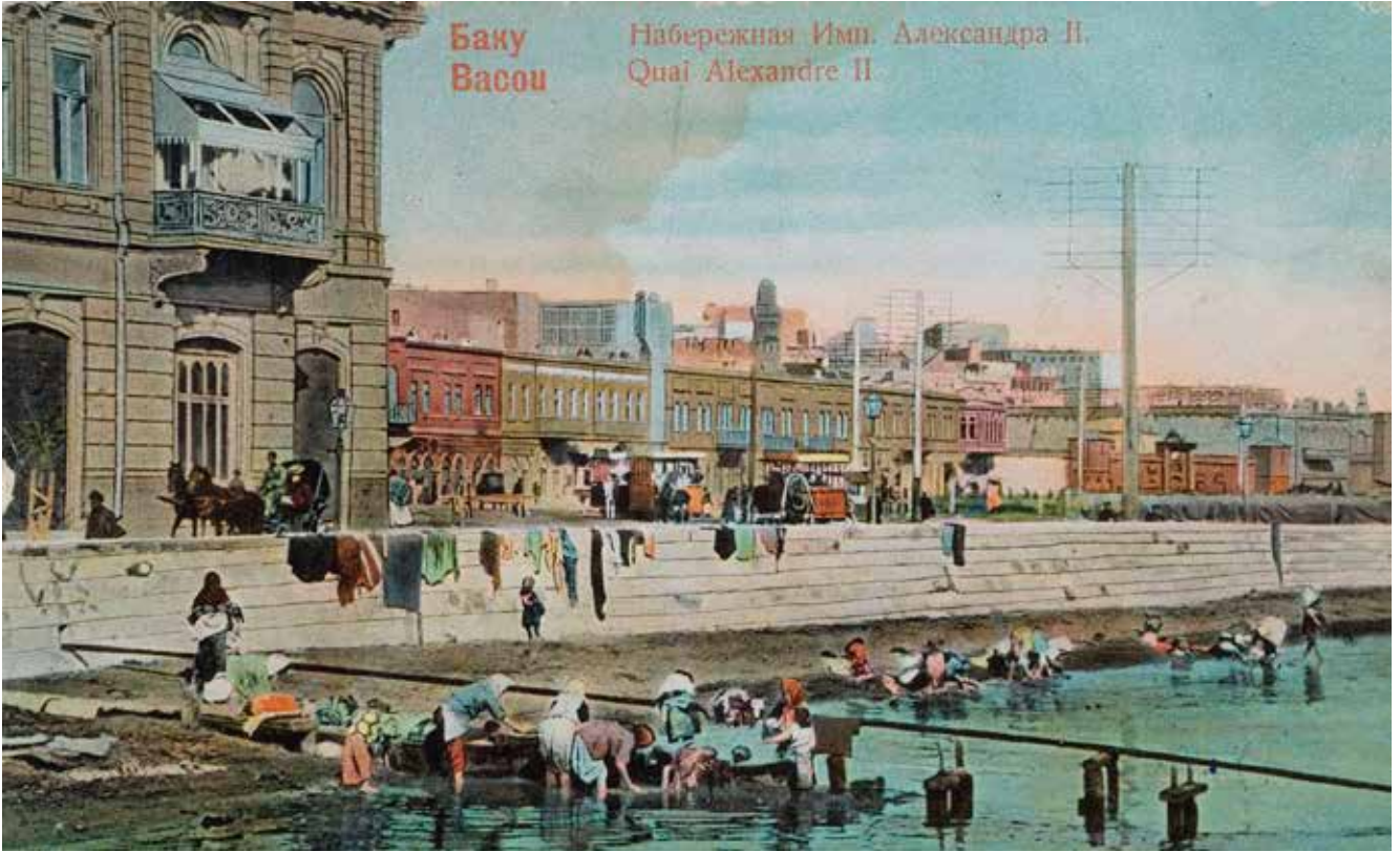
Bakü sahilinde eşya ve haluların yıkanması. 19. yy sonu. Milli Azerbaycan Tarih Müzesi (İlk kez yayınlanıyor)

lanılıyordu. 1950'li yılların sonlarında feci bir gaza olayı yaşandıktan sonra bu kule de faaliyetini durdurdu. Fakat buna rağmen yıkılmadı ve bugün de bulvarda eskinin bir hatırası ola-