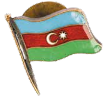
Milletvekili rozeti. Azerbaycan Demokratik Cumhuriyeti Parlamentosu Başkanı Alimerdan Bey Topçubaşov'a aittir. Milli Azerbaycan Tarih Müzesi

ADC'nin kurucuları ise bu zor durumda kendi dönemleri içinde en önde gelen, demokratik yönetim şeklini seçmişlerdir. Yeni cumhuri-