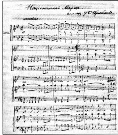
Azerbaycan Cumhuriyeti'nin milli marşı. Beste – Üzeyir Hacıbeyli, söz yazarı – Ahmet Cavad

1919 yılında Bakü Üniversitesi nezdinde Müslüman Doğunun Araştırılması Derneği kurulmuştur. Bu dernek