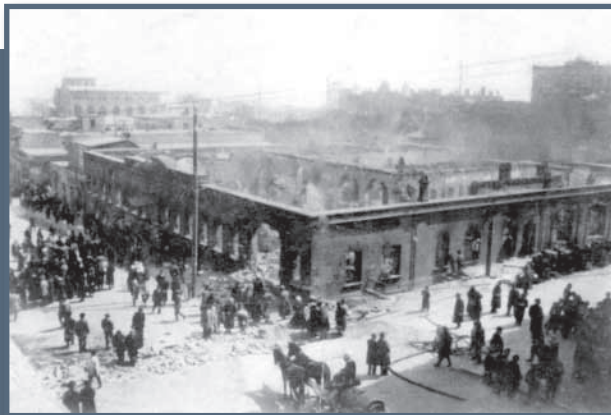
Здание газеты «Каспий»