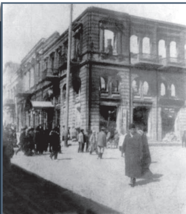
Здание газеты "Ачыг сез" в Баку