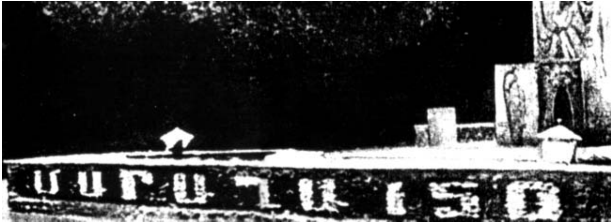
Памятник 150-летию переселения армян в Карабах в селе Марагашен-Ленинаван Мардакертского-Агдаринского района. Открыт в 1978 г., перестроен армянскими сепаратистами в 1988 г. Фото 1978 г.

ничиться присоединением Ахалцихского пашалыка с крепостью Ахалкалаки, а выведенных из Турции под прикрытием войск греков и армян разместить в Имеретии. И.Ф.Паскевич категорически возражал против этого, справедливо указывая, что Имеретия является забытым Богом краем, и будут «нужны многие годы, чтобы трудолюбие человека расчистило вековые леса, осушило болота и, проникнув в места доселе непроходимые, обратило их в сады и цветущие нивы», и добавлял: «...переселять жителей из благословенного климата Турции в места, известные своим убийственным влиянием на здоровье, значило бы подвергнуть их неизбежной гибели» [5, с. 437].