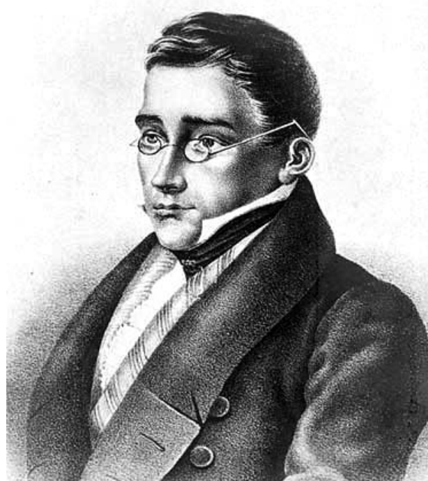
Статский советник, министр-посланник Александр Сергеевич Грибоедов (1795-1829) - идеолог переселения армян в Закавказье

Итак, как было сказано выше, первую волну репатриантов составили армяне Эрзерумского и Байбуртского пашалыков, избравшие для своего жительства земли Ахалцихского пашалыка, отошедшие по Адрианопольскому мирному договору