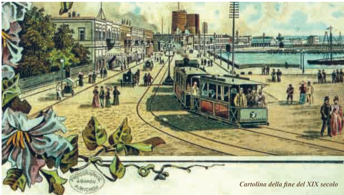
Cartolina della fine del XIX secolo