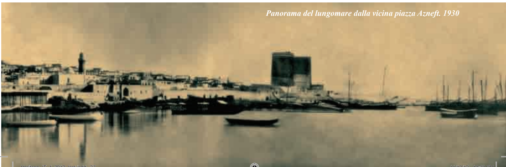
Panorama del lungomare dalla vicina piazza Azneft. 1930

Il 28 aprile del 1936 sul boulevard fu allestita una torre di lancio per paracadutisti di 70 metri di altezza, costruita su richiesta del soviet della città di Baku nella