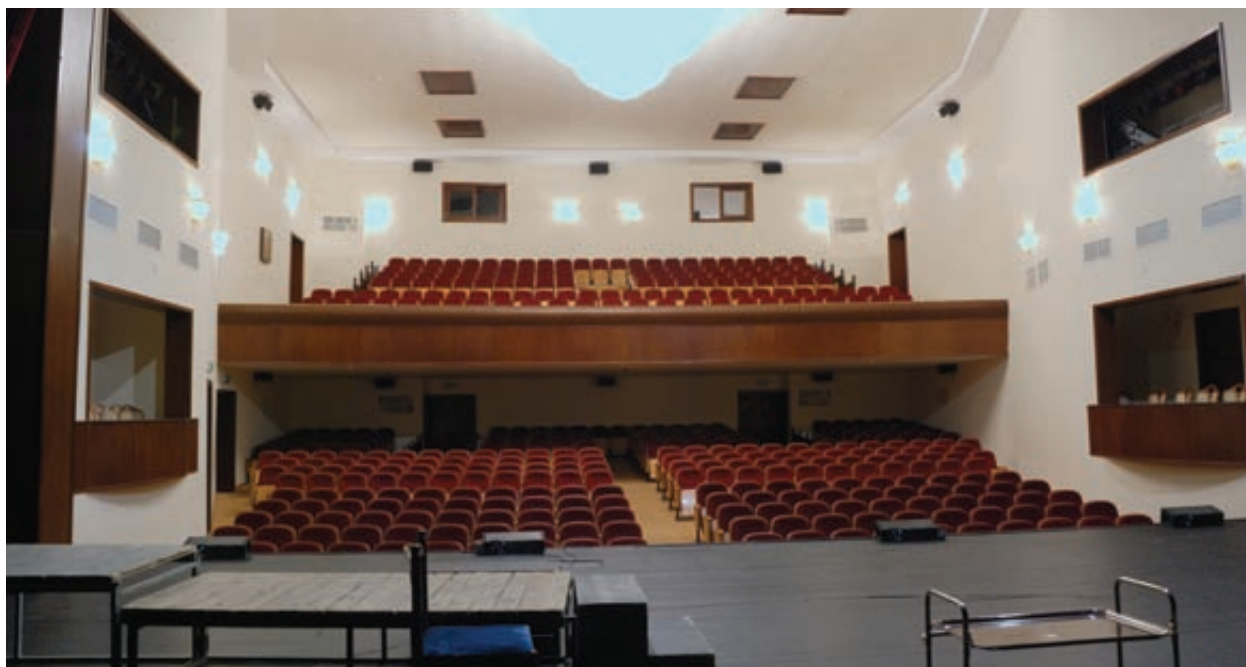
Вид зала после капремонта 2008 г.