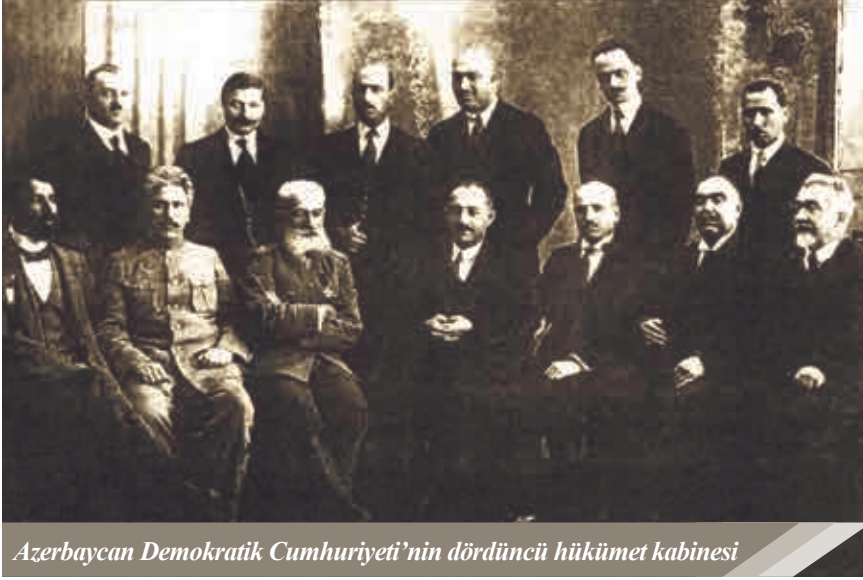
Azerbaycan Demokratik Cumhuriyeti'nin dördüncü hükümet kabinesi

Cumhuriyeti'ni tanımama, uluslar arası alandaki pozisyonunu zayıflatmak için askeri-politik baskı yapma, bölge içindeki devlet bütünlüğü direncini parlamentolarda üyeleri bulunan ve Bakü'de yasal olarak faaliyet gösteren Kafkas ve Bakü'deki Bolşevik organizasyonlar aracılığıyla yıpratma politikası hakimdi. Bu politika 1917-1921 yılları arasında hükmeden Rusya İmparatorluğunun bölgeye yönelik hedefinin bir parçasıydı. Rusya'da meydana gelen iç savaş, kızıl ordu terörü ve iç isyanların yaşandığı kaos sonucunda -ki bu olaylar herkesten önce Rus halkına darbe vurmuştur - Sovyet Devleti adıyla yeni ve çok yönlü bir imparatorluk kuruldu. Bu devlet farklı bir sosyal yapıda, yeni ideolojik ve politik hedefle şekillenmesine rağmen, devlet liderlerinin jeopolitik hedeflerinde bir değişiklik olmadı - daha önce elden çıkmış "kenar bölgeleri" tek elde toplamak ve her imparatorluk için geçerli olan "merkez" ile "bağımlı bölge" arasında sıkı ilişki formu kurmak öncelikli hedefti. Bolşevik Moskova'nın Azerbaycan Demokratik Cumhuriyeti'ne yönelik yürütülen politikalarının ilk başlangıç aşamasından itibaren bölgenin Petersburg'dan yönetilmesi gibi hedef mevcuttu.