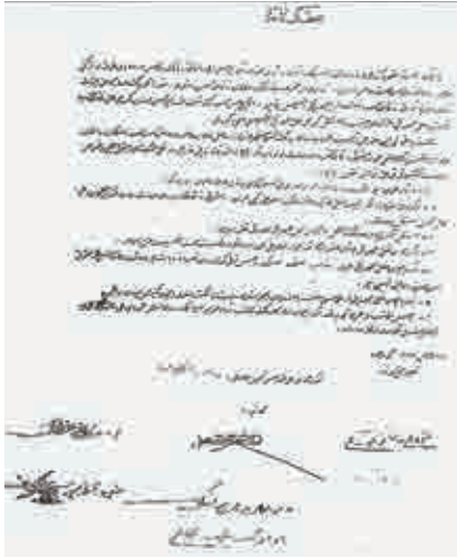
Azərbaycan'ın Bağımsızlık Deklarasyonu