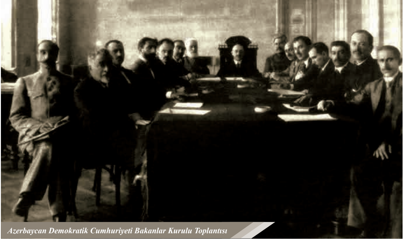
Azerbaycan Demokratik Cumhuriyeti Bakanlar Kurulu Toplantısı

bütün Kafkas halkları gibi Azerbaycan için de iri politik projelerin gerçekleştirilmesi ve varlığının sağlanması için bir şans oldu. Bu konuda Azerbaycan Demokratik Cumhuriyeti liderlerinden birisi: "bu süreç gelecek politik-kültürel ideallerin oluşturulmasına, onların pekiştirilmesine, dini ve tarihi geleneklerimizin korunmasına vesile oldu" (1, sayfa 16-17). Kafkasların Rusya'nın politik merkezlerinden ( Moskova ve Petrograd ) ayırma ve bağımsız olma süreci, birkaç etabı aştı ve Nisan 1818 tarihinde Kafkas Federatif Cumhuriyeti'nin kurulmasıyla sonuçlandı.