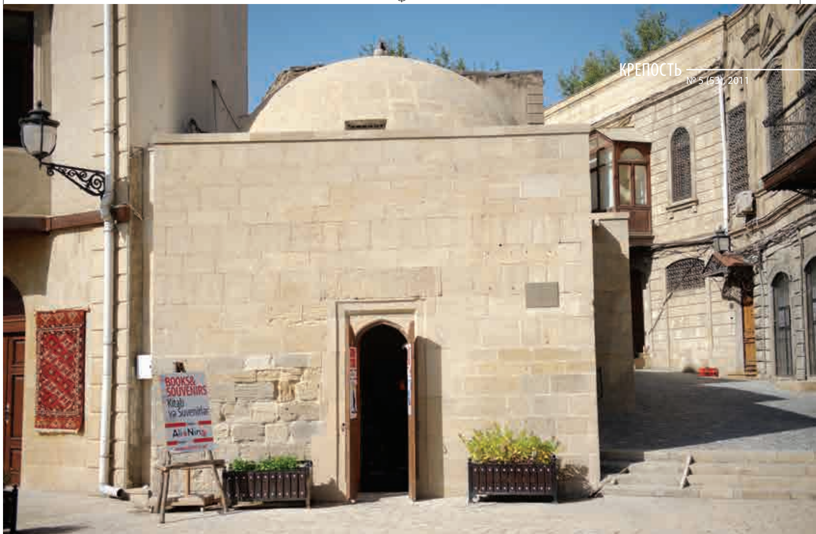
Мектеб-мечеть. Общий вид

среднеазиатских источниках раннего средневековья отмечается, что такого типа статуи считались священными и служили объектом поклонения. Албанский историк VII века Моисей Каланкатуйский подчеркивал, что племена, обитавшие в Азербайджане, высекали из камня статуи, поклонялись им, приносили жертвы.