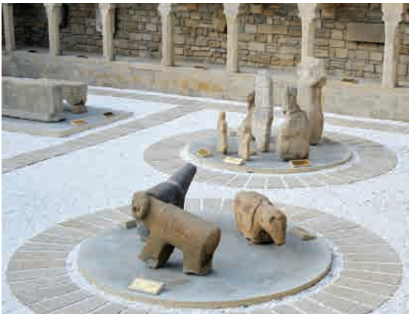
Музей образцов художественной резьбы по камню под открытым небом

Самыми эстетически совершенными образцами художественной резьбы по камню являются работы мастеров бакинско-ширванской школы. Из простого известняка мастера-каллиграфы создавали неповторимые, уникальные произведения искусства.