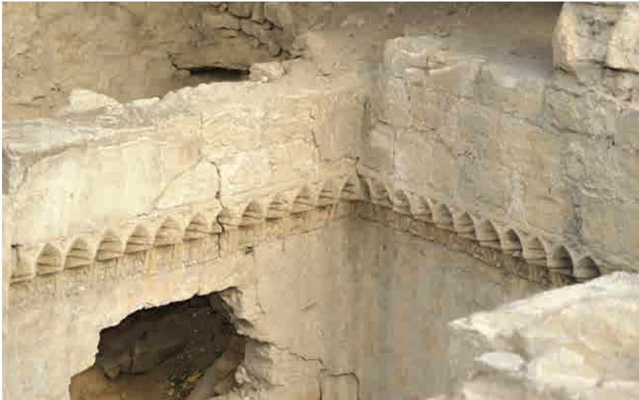
Развалины помещения расположенные рядом с мечетью X века, напротив Ханака

эти двери обращены к восходу и закату, дает основание предположить, что речь идет о храме, относящегося к периоду культа солнца. Входящие в низкие двери храма вынуждены были наклоняться и таким образом кланялись солнцу.