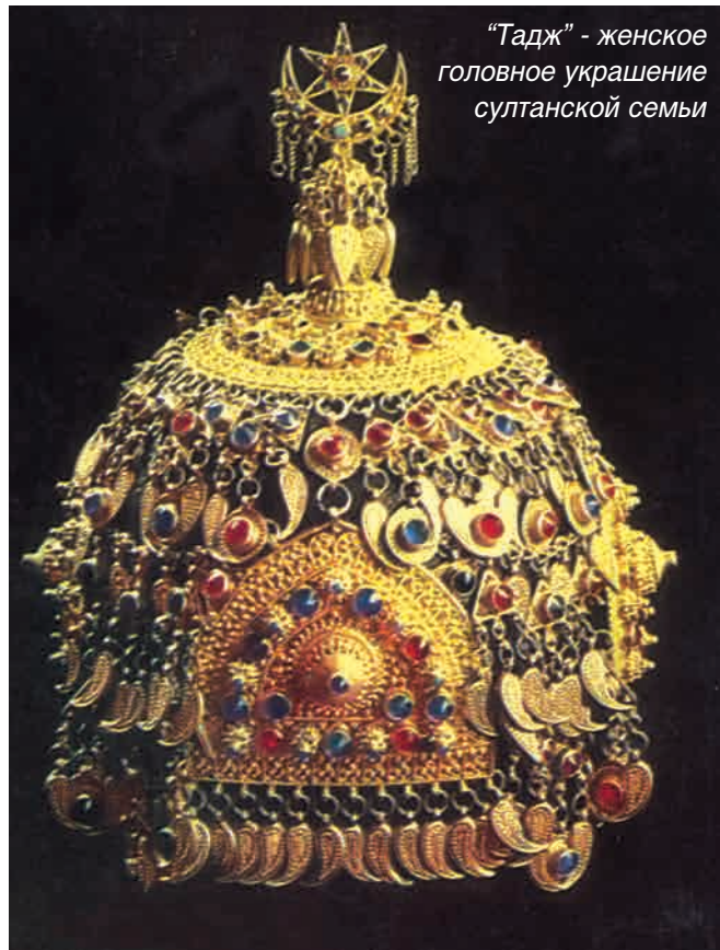
“Тадж” - женское головное украшение султанской семьи

Этноним «цахур» не является самоназванием, а восходит к топониму Цахур — названию главного населенного пункта, где обитал этот этнос.