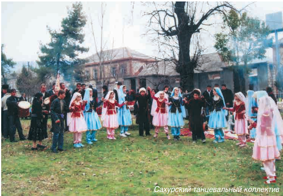
Сахурский танцевальный коллектив

употреблять свинину и конину. Излюбленным мясным блюдом считалась баранина в свежем и сушеном виде. Способы сушения мяса были простыми: тушу барана очищали от внутренностей, солили и вывешивали для сушки. Под влиянием азербайджанской кухни цахуры заготавливали на зиму «бастырма». Для этого нарезанное кусками мясо солили, а затем, перемешав с душистыми травами, складывали в большие глиняные кувшины и закапывали. Впрок заготавливали специальные колбасы - «долма» с чесноком и перцем.