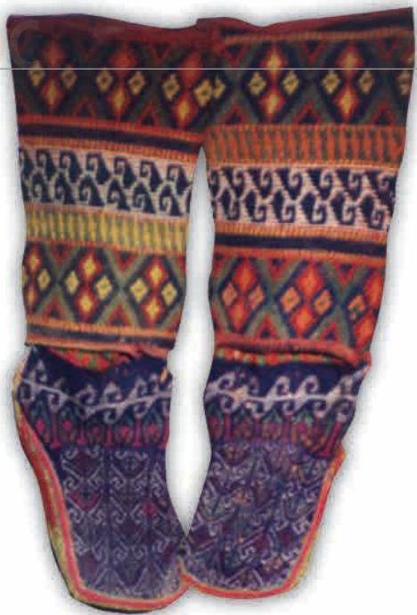
“Шатал” - шерстяная вязаная обувь