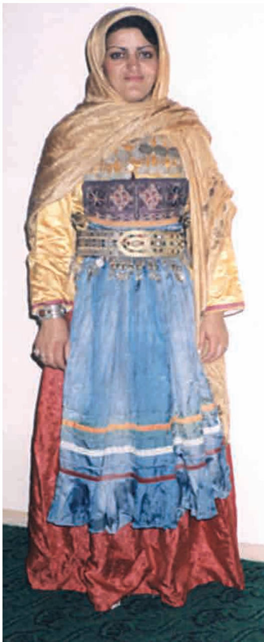
Сахурская женская одежда, XIX в.

Традиционная одежда цахуров типологически сходна с одеждой азербайджанцев и других народов Кавказа. Материалом служили грубые домотканые сукна - «шаль». Зажиточные люди приобретали дорогие привозные сукна - «махуд», бархат, а также дараи и другие шелковые ткани. Наряду с домоткаными сукнами и хлопчатобумажными тканями использовались привозные бязь и ситец. Сукно и шали шли на изготовление мужской верхней одеж-