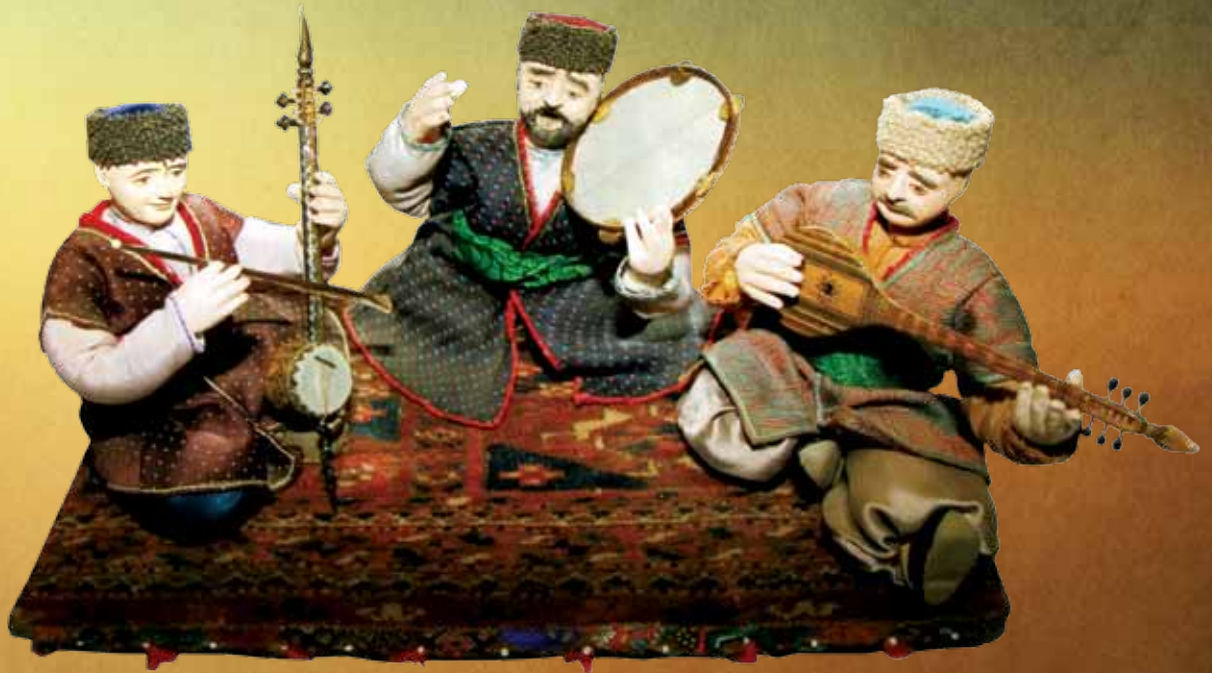
“Вечер мугама”, Фахрийе Халафова, 1999 г. Смешанная техника, 25x35x30

на них вместо пальцев или плектра использовался стержень, концы которого, как тетива у лука, стягивались сухожилиями животных или конским волосом [1]. Специалисты склоняются к мнению о древнеиндийском или среднеазиатском происхождении смычковых инструментов [2].