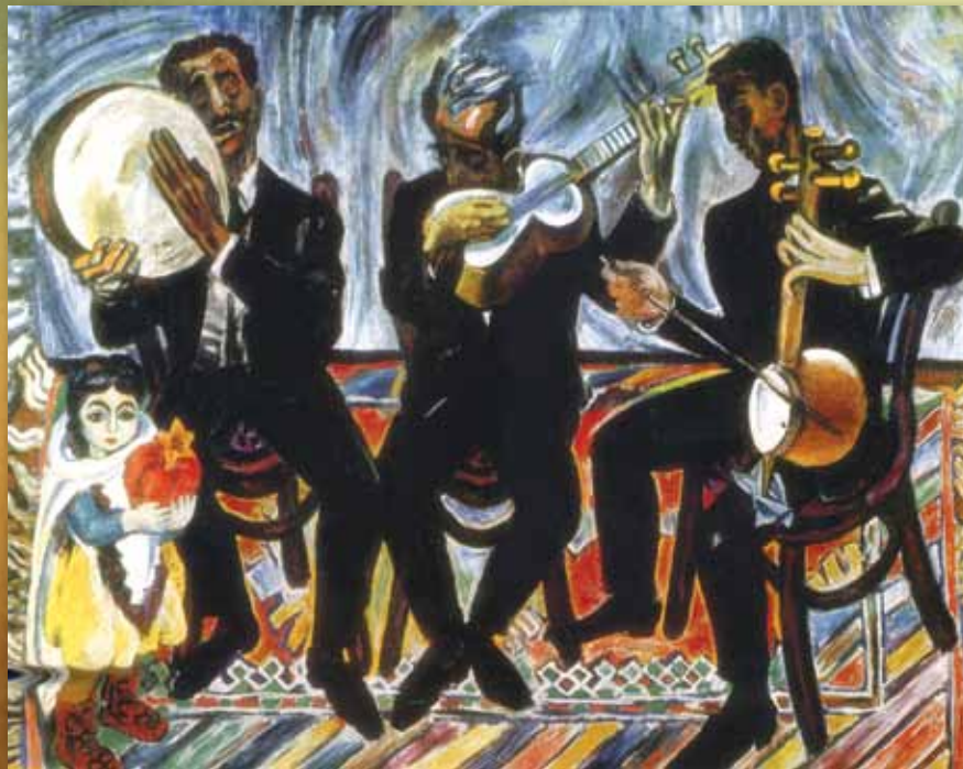
“Мугам”, Тогрул Нариманбеков, 1965 г. Холст, масло, 187x125

Кяманча – самый «певучий» среди азербайджанских народных музыкальных инструментов. По мелизматике, гибкости, динамике, нюансировке кяманча не уступает даже тару, а в кантилене превосходит его.