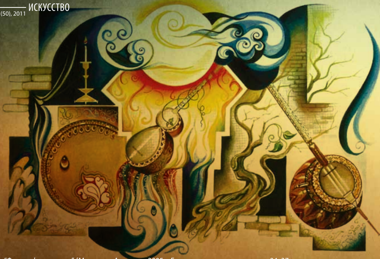
“Философия мугама”, [Метанет Асланова, 2005 г. Бумага, смешанная техника, 34x37

стержень. Общая длина инструмента достигает 700-800 мм. Диаметр открытой части корпуса составляет 100-110 мм, диаметр окружности 180-220 мм, а высота – до 175 мм. Он изготавливается в основном из орехового дерева. На открытую часть корпуса ( уз, перде ) натягивается кожа грудной части крупного сома или бычий пузырь. На деке ближе к шейке наискосок к струнам устанавливается подставка ( хэрэк ) из орехового дерева дугообразной формы длиной 50-60 мм и высотой 10-14 мм. Такое расположение подставки позволяет получить более сильное и качественное звучание как в высоком, так и низком регистрах. Шейка с ровной поверхностью длиной до 450 мм и без ладов постепенно сужается книзу. Гриф изготавливается из роговой пластинки.