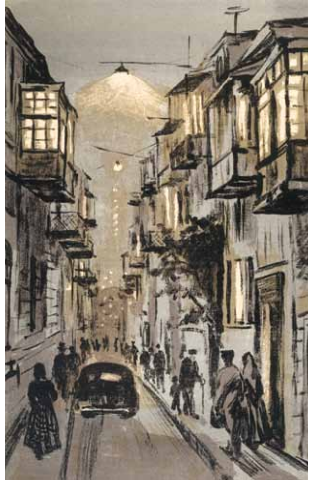
“Ночь”, 1960 г. Цветная литография, 70х46