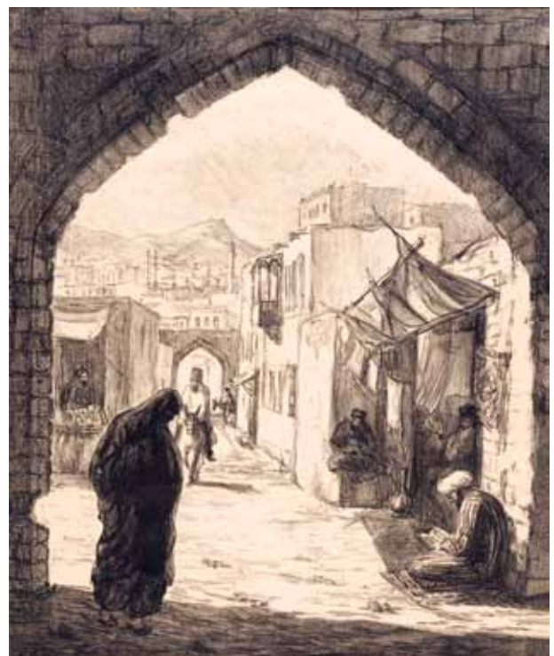
“Старый город”, 1940 г. Автолитография, 40х31,5