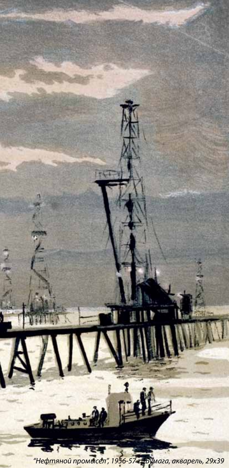
“Нефтяной промысел”, 1956-57 г. Бумага, акварель, 29x39