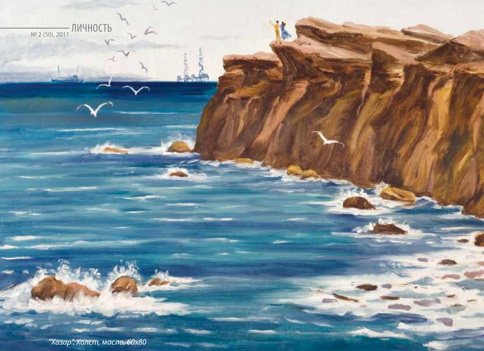
“Хазар”. Холст, масло, 60x80