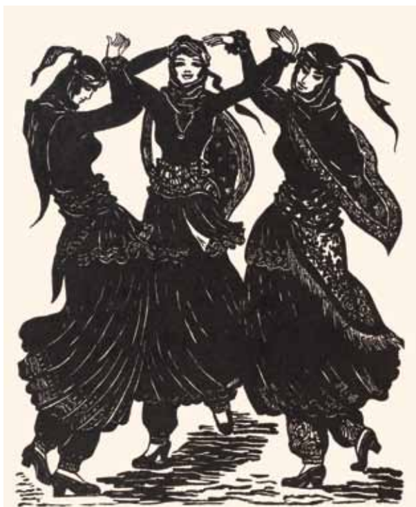
“Танец ленкоранских девушек”, 1970, линогравюра, 62x41

смысле считают кровью Земли), полны искреннего, романтического трепета, чувственности, изысканности и высокого стиля, они выполнены в духе великих французских романтиков и наполняют нас ощущением драматизма и величия (это работы 1940–1950 годов).