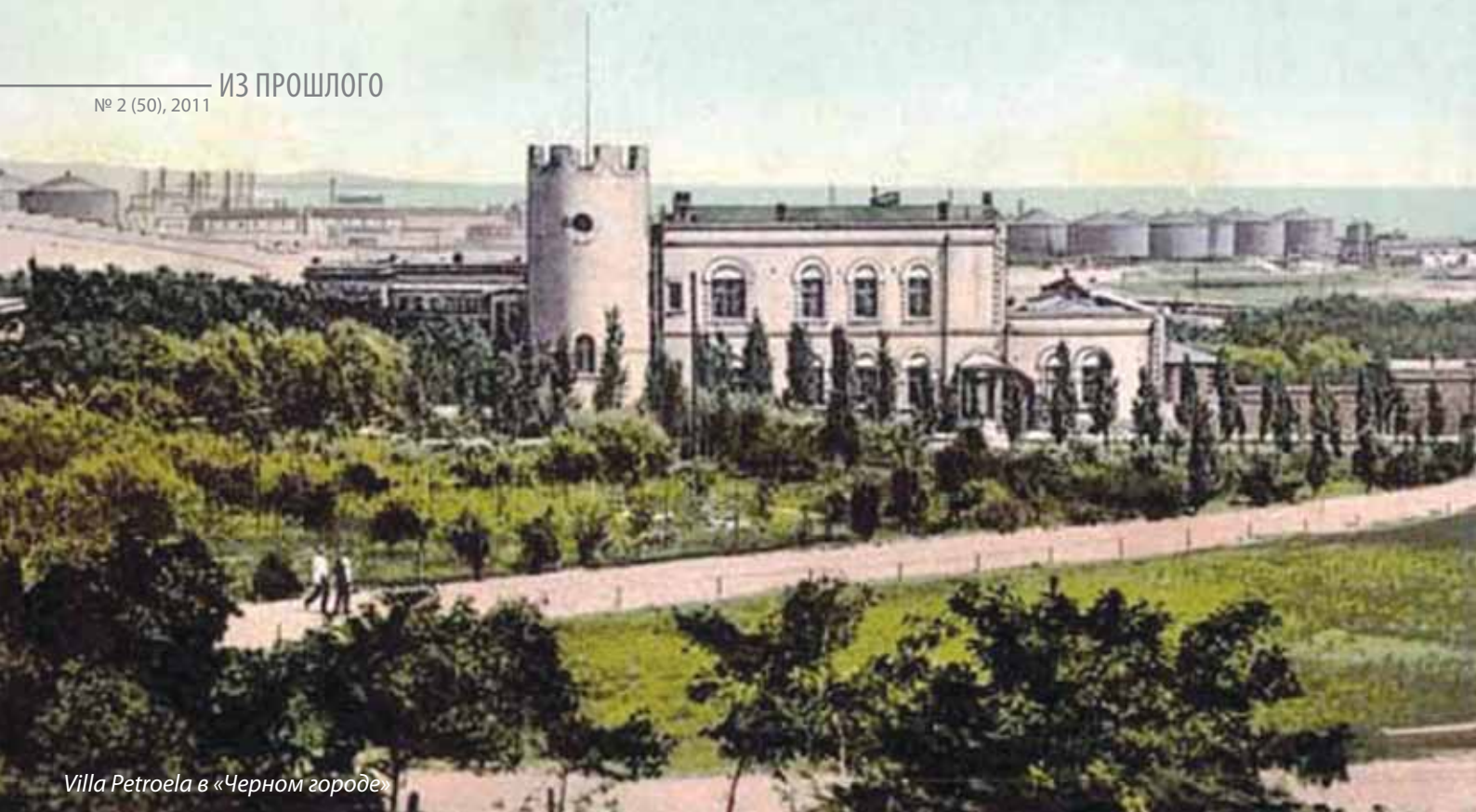
Villa Petrolea в «Черном городе»

в городе строго запрещалось строить заводы вне пределов «Черного города».