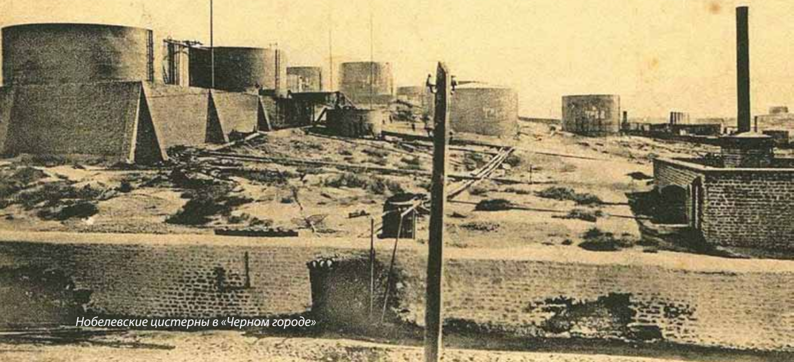
Нобелевские цистерны в «Черном городе»

Имя архитектора - автора генерального плана и зданий с характерными для юга террасами, верандами и балконами пока установить не удалось, хотя несомненно, что архитектор был: об этом свидетельствуют умело выполненная вертикальная планировка с учетом террас и в целом композиционная идея парка. По-видимому, все это разрабатывалось неизвестным архитектором при участии Э.Бекле.