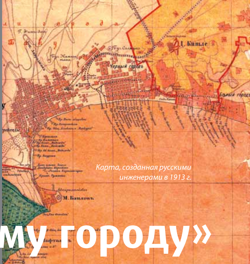
Карта, созданная русскими инженерами в 1913 г.

Термин «Ичеришехер», обозначающий древнейшую часть Баку, имеет двухсотлетнюю историю. После захвата Россией в 1806 году город стал расти ускоренными темпами и вышел за пределы крепостных стен. Особенно этот процесс усилился после 1850 года, с началом быстрого развития капитализма. Именно в этот период Баку разделился на внутренний и внешний город.