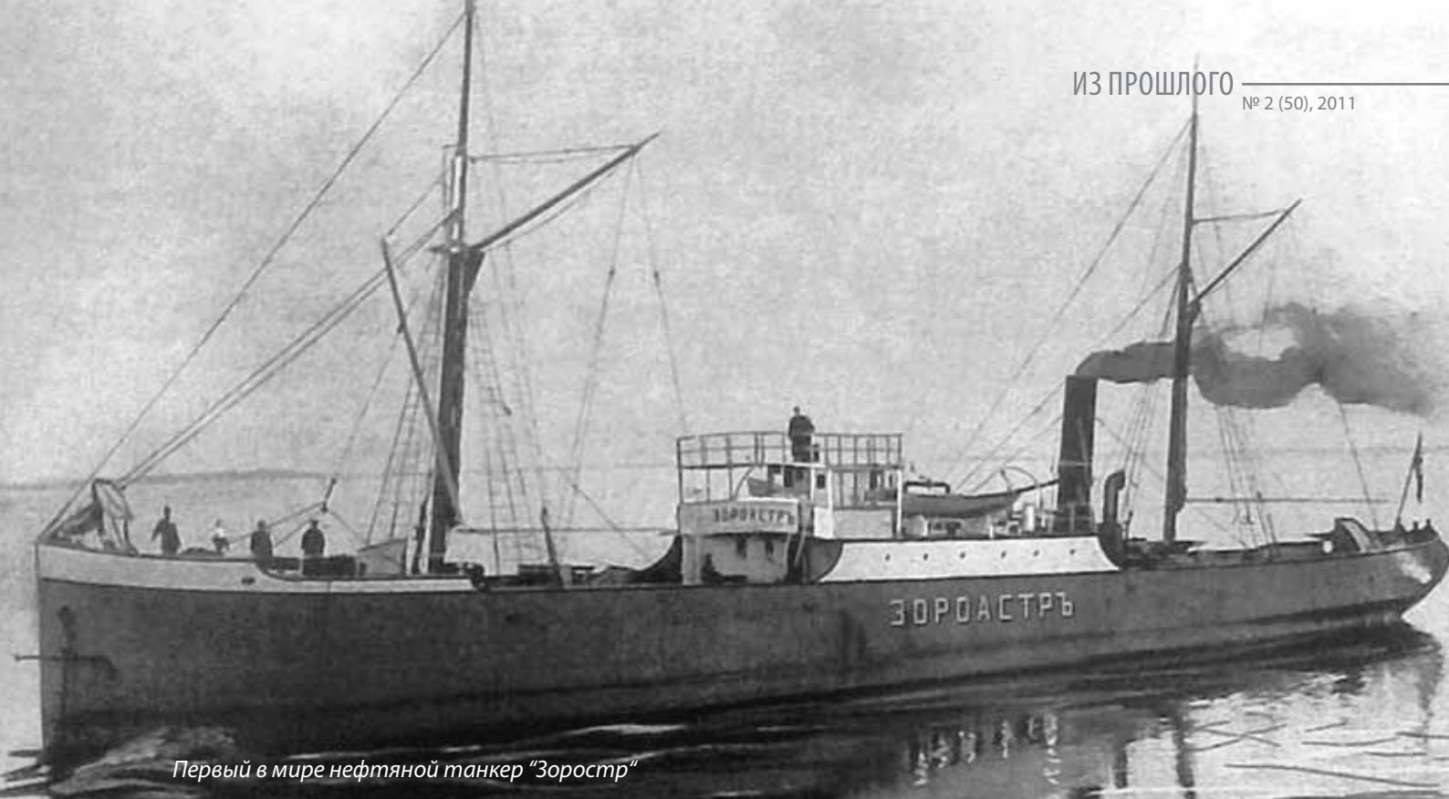
Первый в мире нефтяной танкер "Зороастр"

работать, и тем более жить в неблагоприятных условиях заводского района Баку. В это же время тема строительства жилья для рабочих стала одной из самых актуальных в архитектуре. Вблизи участков нефтяного производства братьев Нобель начали возникать поселки для рабочих и служащих - «нобелевские городки», в которых впервые для того времени были предусмотрены функции труда, быта и отдыха. Нобелевские городки строились вне уже существовавших кварталов и включали в себя начальные школы для детей рабочих, аптеки, службы санитарного надзора, больницы, бани, столовые, хлебопекарни. Нобели серьезно относились к подготовке квалифицированных рабочих кадров для своих предприятий и не скупилась на расходы по образованию. Для старших служащих строились залы для увеселительных собраний, бильярд и кегельбан. Жилье было двух типов - квартиры для семейных рабочих и служащих и жилища казарменного типа для холостяков. Для рабочих-мусульман выделяли специальные помещения для отправления религиозных обрядов.