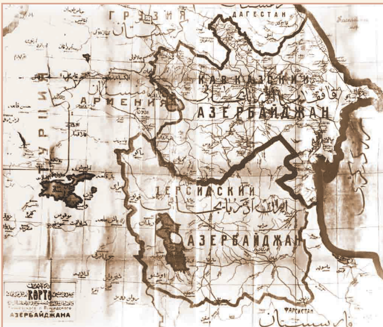
Карта Кавказского и Персидского Азербайджана, составлена в 1920 году

карте Каспия приморскую территорию от Дербенда на севере до Гилана на юге называет "Азербайджан". Арабский халифат был разделен на провинции, одна из которых согласно арабскому автору XII/XIII века Ибн ал-Асиру именовалась также Азербайджаном. Однако некоторые исследователи под влиянием политической конъюнктуры пренебрегают данными источниками, даже пытаются фальсифицировать их. В частности, А.П.Новосельцев, приводя в переводе с арабского на русский географические названия, обозначенные на карте Ибн Хаукаля, почему-то не раскрыл слова "Азербайджан, простирающийся от Дербенда до Гилана", приведенные в арабском тексте автора. (7) Эта карта, опубликованная на обложке книги А.П.Новосельцева, является важным историческим источником, опровергающим домыслы тех, кто против употребления дефиниции "Азербайджан" применительно к территории всей страны. Известно, что обе части Азербайджана не раз входили полностью или частично в состав единого государства. Среди таких государств - созданные предками азербайджанцев Маннейское царство, государства атабеков Азербайджана, Хулагидов, Ак-Коюнлу, и самое значительное в этом ряду - Сефевидская империя, в состав которой азербайджан-