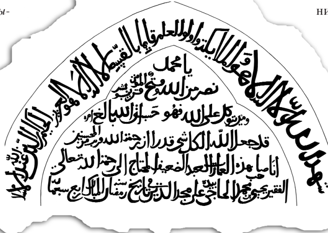
Надпись мавзолея Йахьи ибн Мухаммада. Село Мамедбейли Зангеланского р-на. Графическое изображение

Двухстрочная надпись высечена над входом в круглый