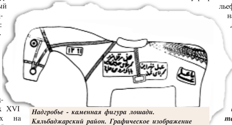
Надгробье - каменная фигура лошади. Кяльбаджарский район. Графическое изображение