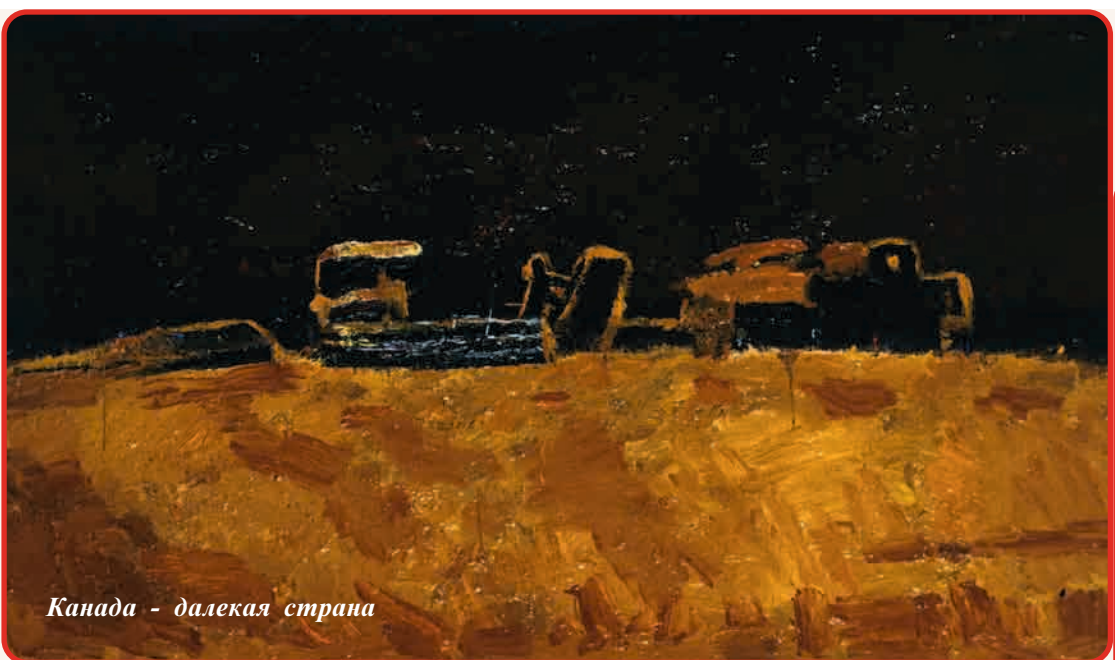
Канада - далекая страна

Портреты, созданные Ашрафом Мурадоглы, всегда вырываются из густых красок, составляющих фон композиции. Все светлое на картинах сконцентрировано в контурах самих портретов. Его персонажи освещены красками, словно актеры на сцене светом рамп. Это проистекает из чисто эпического восприятия героя. В этом смысле Ашраф Мурадоглы - истинно азербайджанский художник. Для азербайджанца герой всегда стоит высоко, в центре внимания, виден со всех точек. Однако в героях Ашрафа Мурадоглы ощущается постоянное напряжение, сопротивление. Они в состоянии постоянной борьбы со средой, с фоном. Так, фигуры на его женских портретах, изображенные резкими мазками, кажется, вот-вот могут сломаться. Однако благодаря какой-то внутренней силе они возносятся