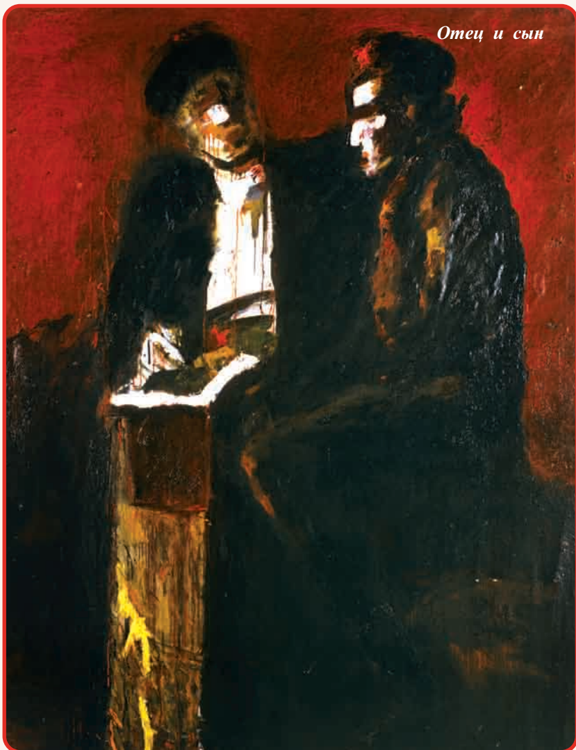
Отец и сын

Для воссоздания образов государственных руководителей военных лет - Рузвельта, Черчилля и Сталина в картине "Тегеранская конференция" художник обращается к стилю монументальной живописи. Поэтому полотно напоминает мексиканские настенные росписи. В центре диагональной перспективы картины - Сталин. Возвышаясь над остальной группой, он тянет руку к пачке "Беломора". И это повелительное движение руки играет важную роль в определении направления композиции картины, и в то же время имеет очень символическое значение. Ведь всем известно, что Сталин курил папиросы "Герцеговина Флор". Но художник