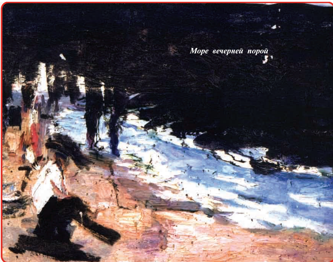
Море вечерней порой